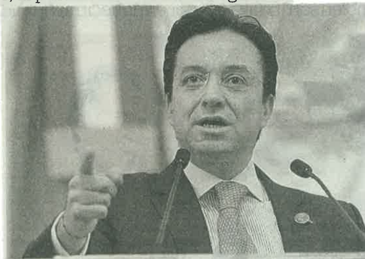
■ Solicitan conocer el estatus de varias obras inmobiliarias

Dijo que los vecinos de las colonias Lomas de Reforma y Lomas Altas solicitaron el apoyo de los legisladores, debido a la violación al uso del suelo y daños severos al medio ambiente, ya que en esa zona no se pueden construir edificios con más de cinco pisos y estas construcciones están diseñadas para que sean hasta diez veces más altas.