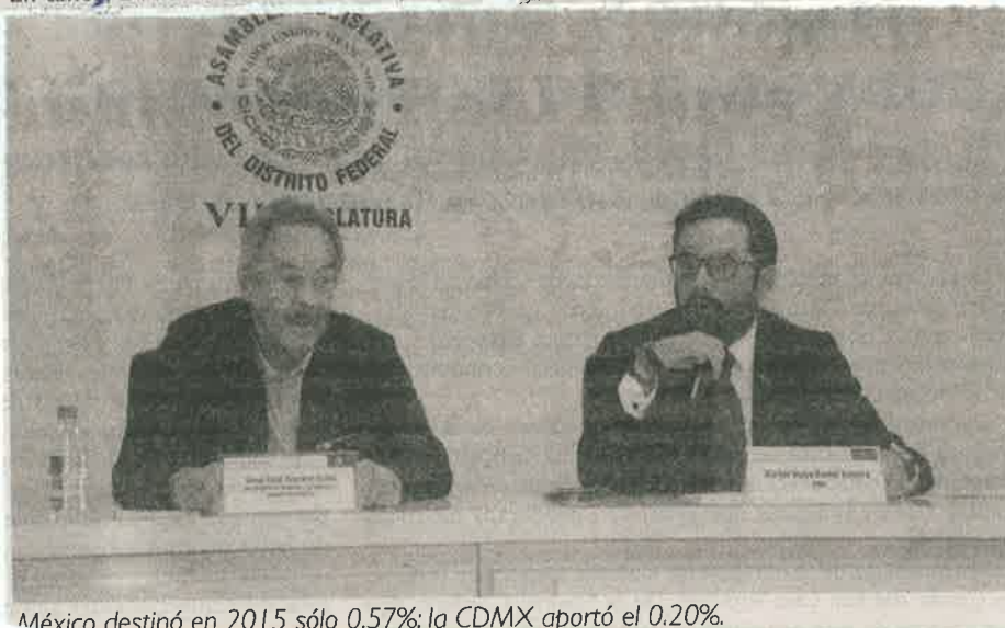
México destinó en 2015 sólo 0.57%; la CDMX aportó el 0.20%.

la ALDF, por fin haya alguien interesado en la ciencia y la tecnología, independiente de pertenecer a algún partido político, la importancia de promover una iniciativa que contemple incrementos anuales que permitan llegar a 1% del Presupuesto de Egresos de la ciudad, como lo marca la Ley de Ciencia, Tecnología e Innovación del Distrito Federal es fundamental, ya que son herramientas fundamentales para resolver problemas sociales, educativos y de salud, entre otros, pero no tenemos suficientes recursos".