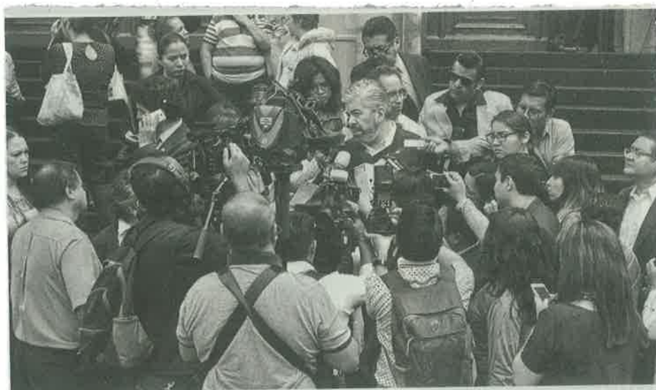
PRD asegura que es un caso jurídico, no político.