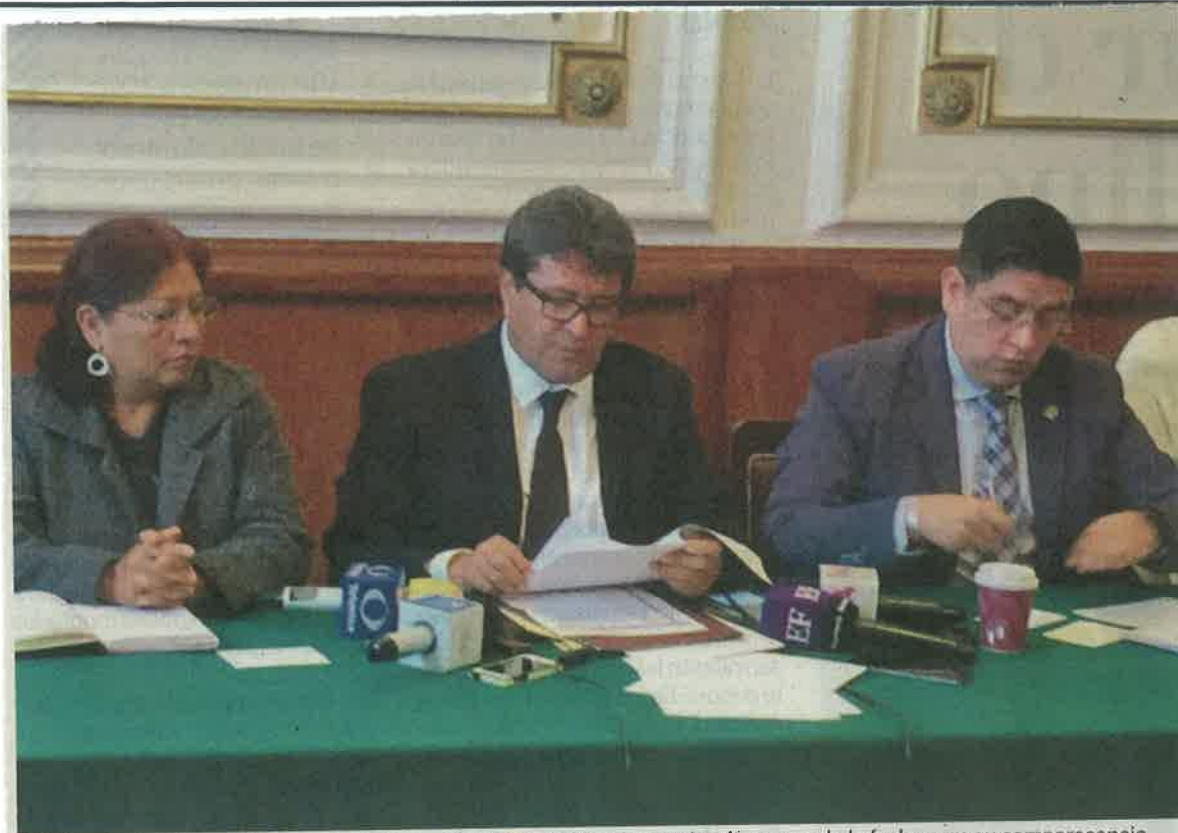
El delegado de la Cuauhtémoc se reunió con diputados de Morena previo a la espera de la fecha para su comparecencia.