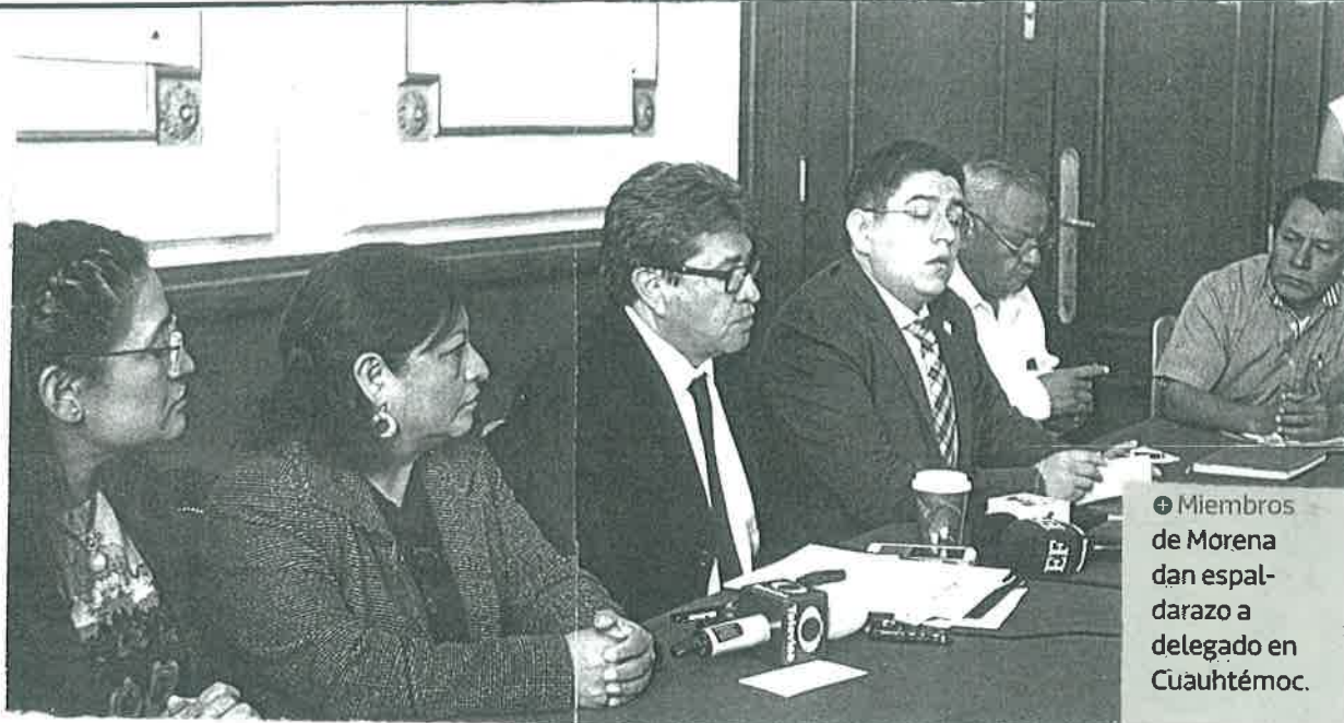
⊕ Miembros de Morena dan espal- darazo a delegado en Cuauhtémoc.