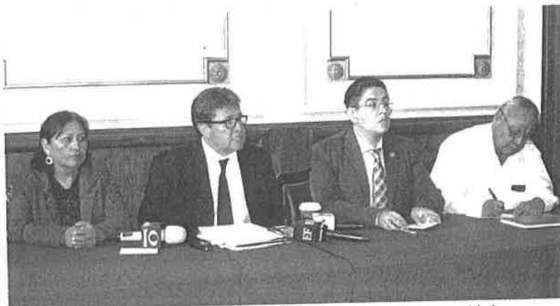
EL DELEGADO Ricardo Monreal (centro), ayer, en conferencia en la Asamblea Legislativa.