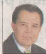
René Arce Islas

ra empezar, modificaron inmediatamente el formato del Informe para que ya no hubiera preguntas que incomodaran al Jefe de Gobierno; la rendición de cuentas se convirtió en el día del gobernante, tribunas y calles se llenaron de acarreados; inmediatamente después se modificó la Norma 26 y los grandes negocios inmobiliarios se pudieron realizar por toda la ciudad sin respetar la planeación y el desarrollo urbano que diera calidad de vida a los capitalinos; se cooptó a muchos diputados de otros partidos con espacios en el gobierno, negocios inmobiliarios o de otro tipo y el dinero fluyó de manera impresionante para el supuesto trabajo legislativo; en suma, la Asamblea Legislativa se volvió un redil manso y sumiso como en la mejores épocas del PRI-gobierno; corrupción y falta de transparencia como en la Línea 12 del Metro se volvió algo común en la mayor parte de las actividades del gobierno de la ciudad, una ciudad sin contrapesos en los poderes, caótica en su movilidad y sin resolver problemas añejos como la contaminación la inseguridad, depósito de residuos orgánicos e inorgánicos, etc. fue la herencia que el mejor alcalde del mundo nos dejó a los habitantes de la ciudad ¡Ah!, también nos dejó como su sucesor al licenciado Mancera, quien acaba de rendir su IV Informe, del cual hablaremos en la Segunda Parte de este artículo.