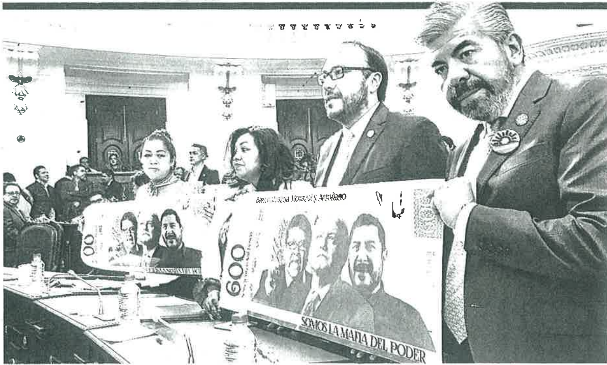
Billetote de Morena. Diputados locales del PRD presentaron ayer, en la Asamblea Legislativa del Distrito Federal, una réplica de papel moneda con las imágenes de López Obrador, Monreal y Batres con un valor de 600 mil pesos, por el caso de De Antuñano.

● María Chavarri, vecina de la Condesa, dijo que no es explicable la operación de establecimientos en esta zona. Mencionó que Pedro Pablo de Antuñano recibió quejas de los colonos pero nunca hizo nada para resolver la problemática.