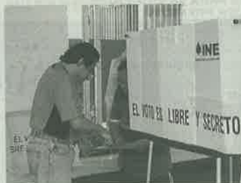
Ya se aplica en 80 países

Indicó que la segunda vuelta electoral se concibe como un mecanismo de fortalecimiento