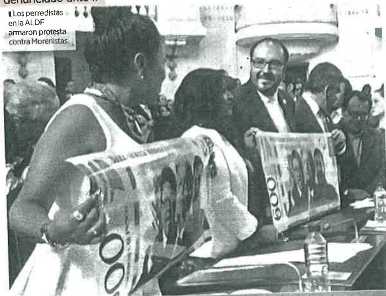
Los perredistas en la ALDF armaron protesta contra Morenistas.