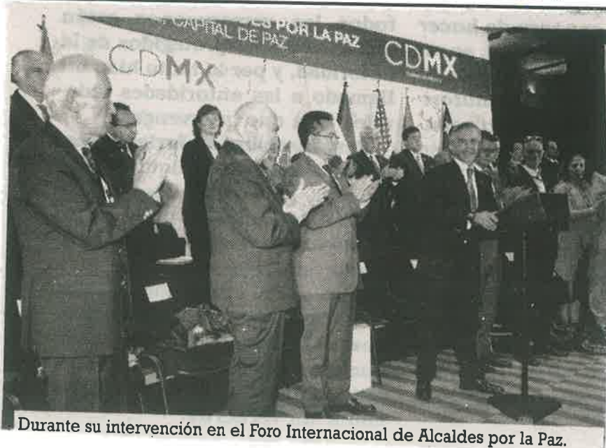
Durante su intervención en el Foro Internacional de Alcaldes por la Paz.