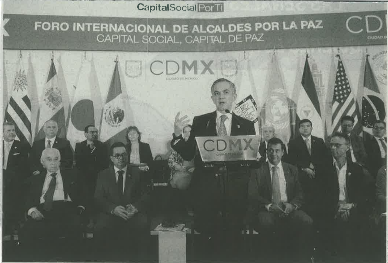
Mancera en el Foro Internacional "Alcaldes por la Paz", en el que destacó el programa "Desarme voluntario".