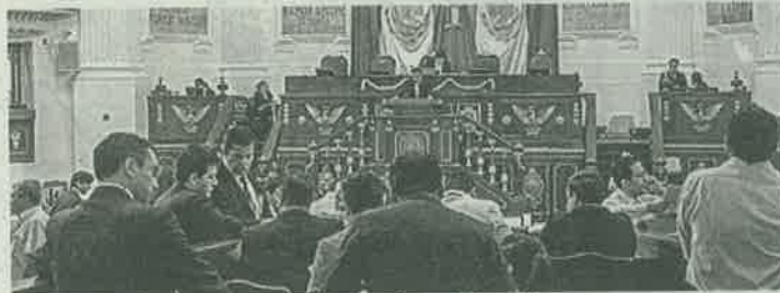
Buscan impedir que funcionarios pidan dinero en la calle

va constitucional con proyecto de decreto por el que se adiciona una fracción XII al artículo 167 del Código Nacional de Procedimientos Penales; en materia de operaciones con recursos de procedencia ilícita.