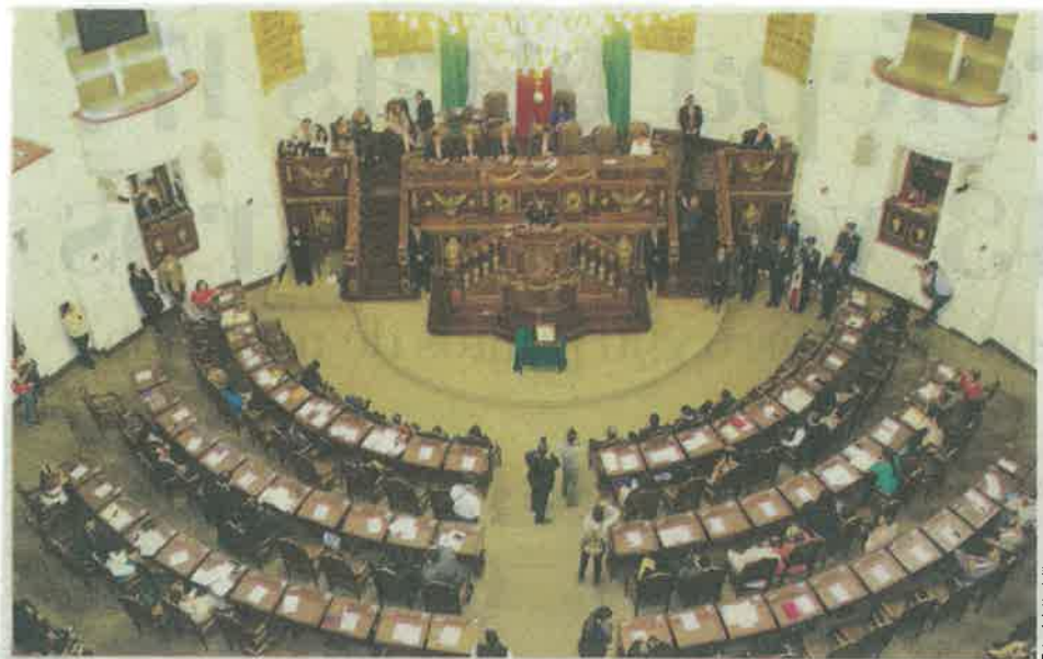
El recurso figurará en la Ley Electoral que tendrá que crear la Asamblea Legislativa.

de los votos debe tener el ganador para evitarla