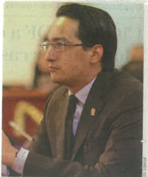
Pese al exhorto, Atáyde pidió al Gobierno local usar de manera eficiente su recaudación.

Asimismo, pidió no hacer uso político del Fondo de Capitalidad y, pese a apoyar su existencia, ver qué tiene que decir al respecto la Secretaría de Hacienda.