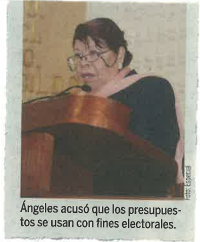
Ángeles acusó que los presupuestos se usan con fines electorales.

En este sentido, aseguró que lo sucedido durante la jornada para elegir Constituyentes, deja a la vista la posibilidad de que los presupuestos asignados a programas sociales se hayan destinado para fines electorales.