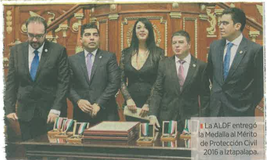
La ALDF entregó la Medalla al Mérito de Protección Civil 2016 a Iztapalapa.

La entrega de la medalla se realizó en la Asamblea Legislativa en el marco del simulacro por el aniversario luctuoso del sismo de 1985.