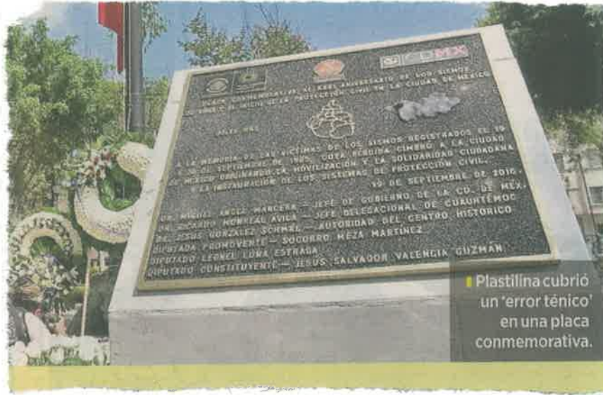
Plastilina cubrió un 'error técnico' en una placa conmemorativa.