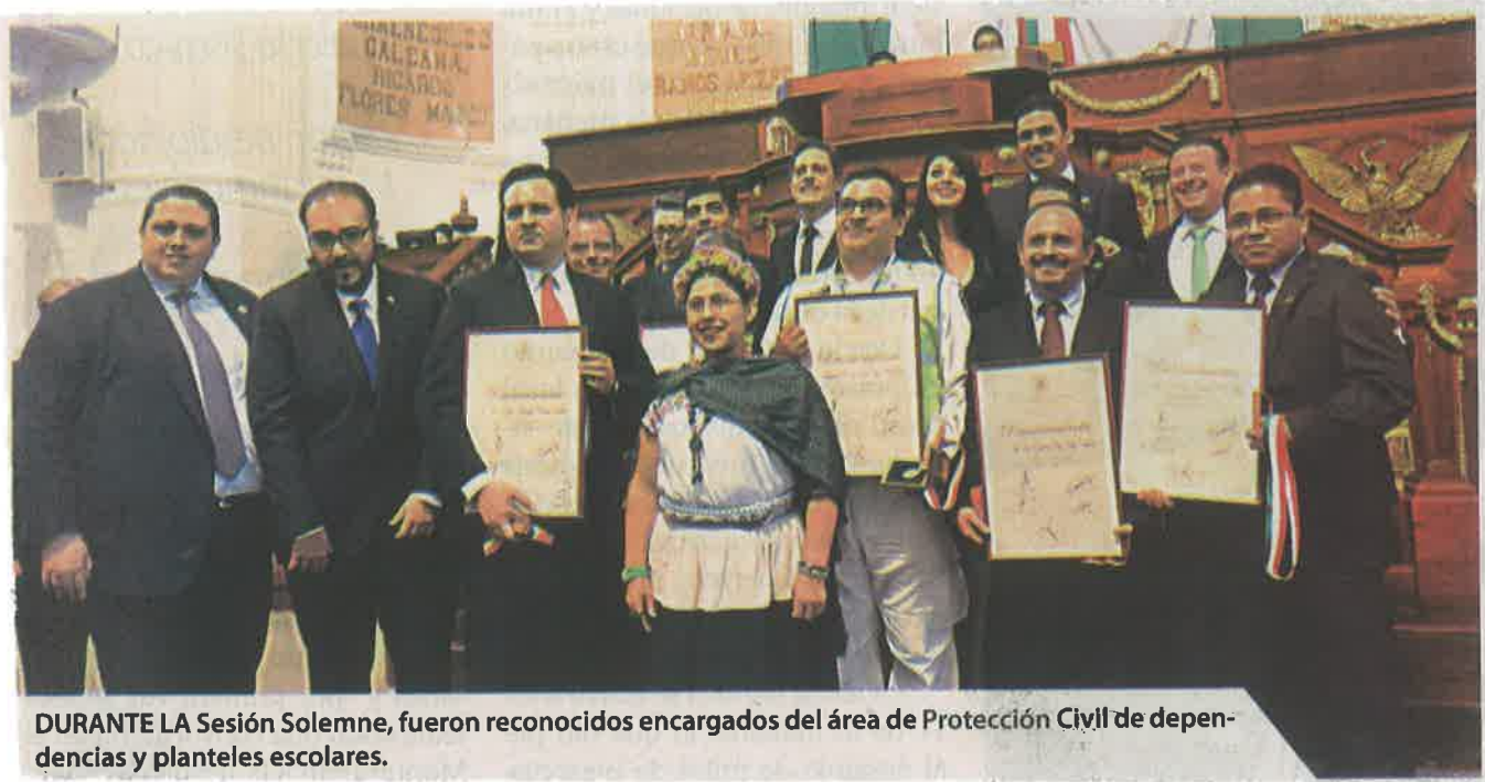
DURANTE LA Sesión Solemne, fueron reconocidos encargados del área de Protección Civil de dependencias y planteles escolares.