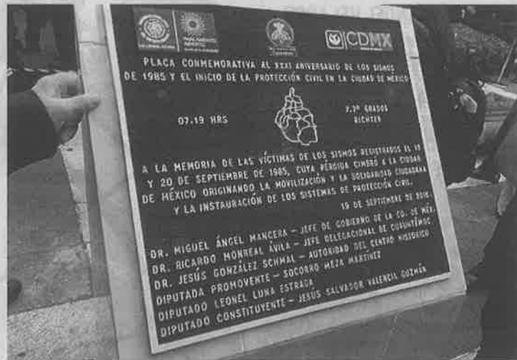
■ Dice que el movimiento fue de 7.7 grados Richter, y no de 8.1