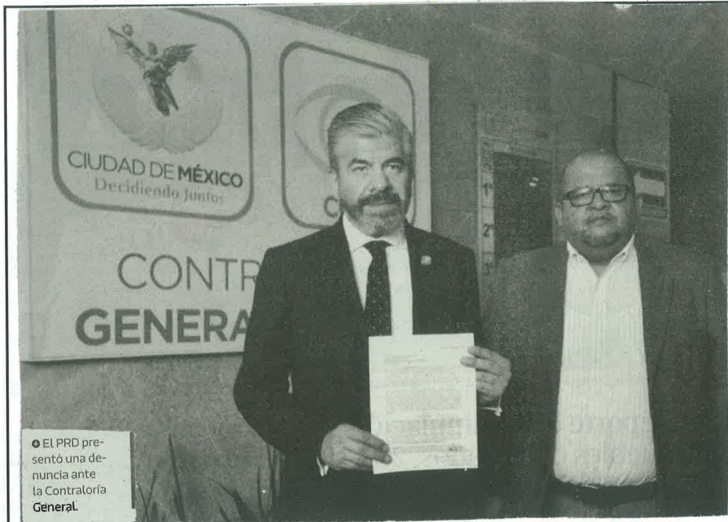
El PRD presentó una denuncia ante la Contraloría General.