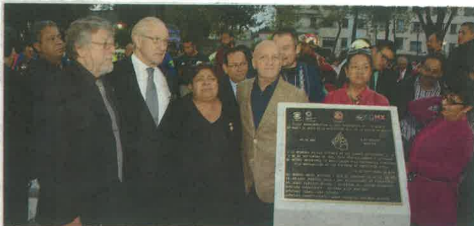
La insignia conmemorativa fue retirada de la Plaza de la Solidaridad para su corrección porque decía que el temblor tuvo una intensidad de 7.7 grados, en vez de 8.1.

Además de la inclusión de 100 peritos de obras que revisarán de manera directa las escuelas de la Ciudad de México a fin de cuantificar los posibles daños y disminuir las pérdidas personales y materiales. C