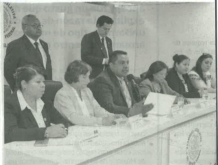
➤ Morena denuncia que serán talados mil 700 árboles.

Transcurrido el tiempo de consulta, se espera una audiencia pública con vecinos, empresarios, autoridades y expertos.