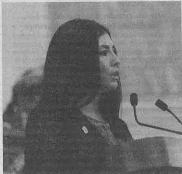
La probabilidad de que emergencias se conviertan en desastres en CDMX es alta.

Apuntó, "con los recientes cambios legislativos en materia de desarrollo urbano y construcciones, planteados por el PAN, buscamos dar continuidad y canales formales a la participación ciudadana en las cuestiones que más les preocupan: las construcciones y el uso del suelo, que afectan sus condiciones de habitación y calidad de vida".