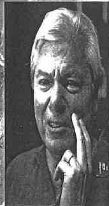
CARLOS HANK RHON