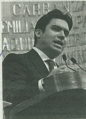
Romero presentó la iniciativa

Se trataba de una práctica del titular del Ejecutivo local para mandar a la congeladora cualquier ley o decreto suficientemente discutido y aprobado por el Pleno de la Asam-