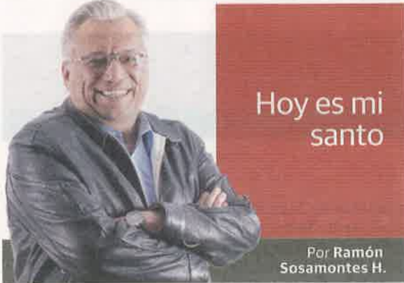
Por Ramón Sosamontes H.