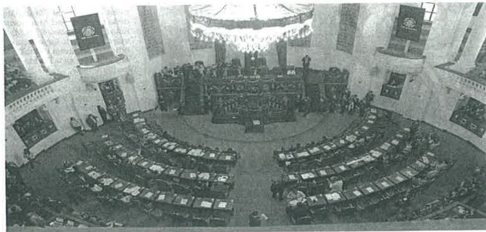
Siguen en la “congeladora” normas como la Ley de Participación Ciudadana y la de Dignificación Judicial.