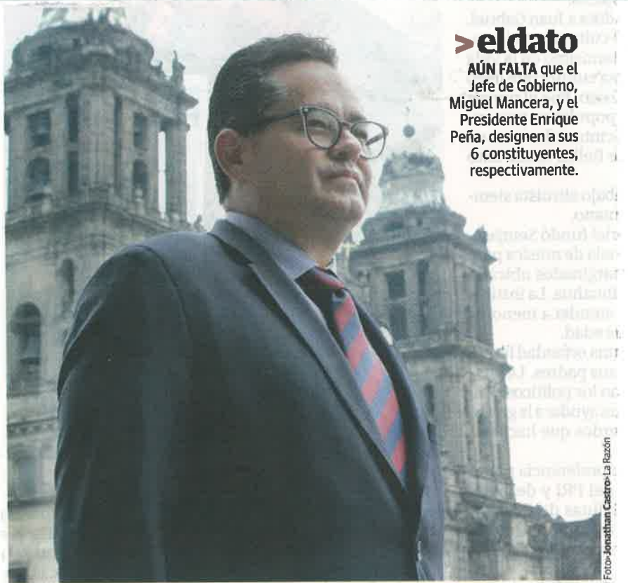
EL DIPUTADO Leonel Luna caminando por el Zócalo el pasado 24 de agosto.

Además tendremos la presentación de iniciativas, la aprobación de reformas, foros; traemos los distintos grupos parlamentarios temas importantes; tendremos toda una ruta para el sistema local anti-corrupción. Esperamos tener un periodo ordinario productivo.