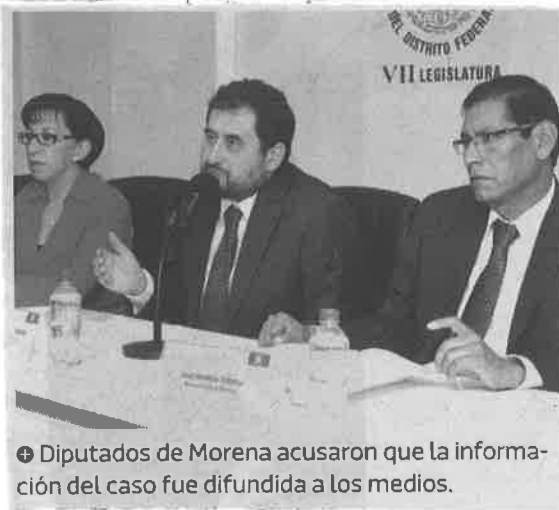
⊕ Diputados de Morena acusaron que la información del caso fue difundida a los medios.