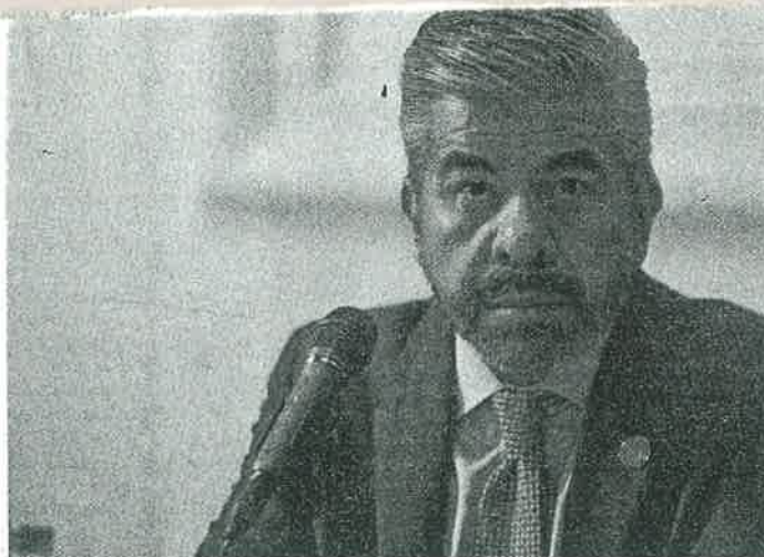
El objetivo es llegar a 2017 con un horizonte de planeación más certero y oportuno.