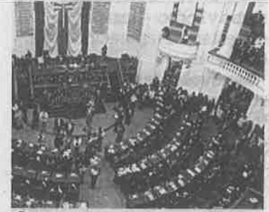
Lamentan que no participe

Manifestaron su preocupación por que al no integrarse a las comisiones no participan en el verdadero debate de las ideas. B!