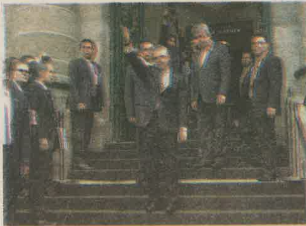
La ALDF decidirá si hay cambios en formato de informe de MAM

En cuanto a pedir más recursos para el Fondo de Capitalidad, expuso “que haya un recorte al presupuesto lo entendemos; vamos a ver en que rubros está el recorte al presupuesto, pero hay cosas muy importantes: fondo de capitalidad es muy importante, programas sociales es muy importante; entonces, ahí vamos a seguir insistiendo”.