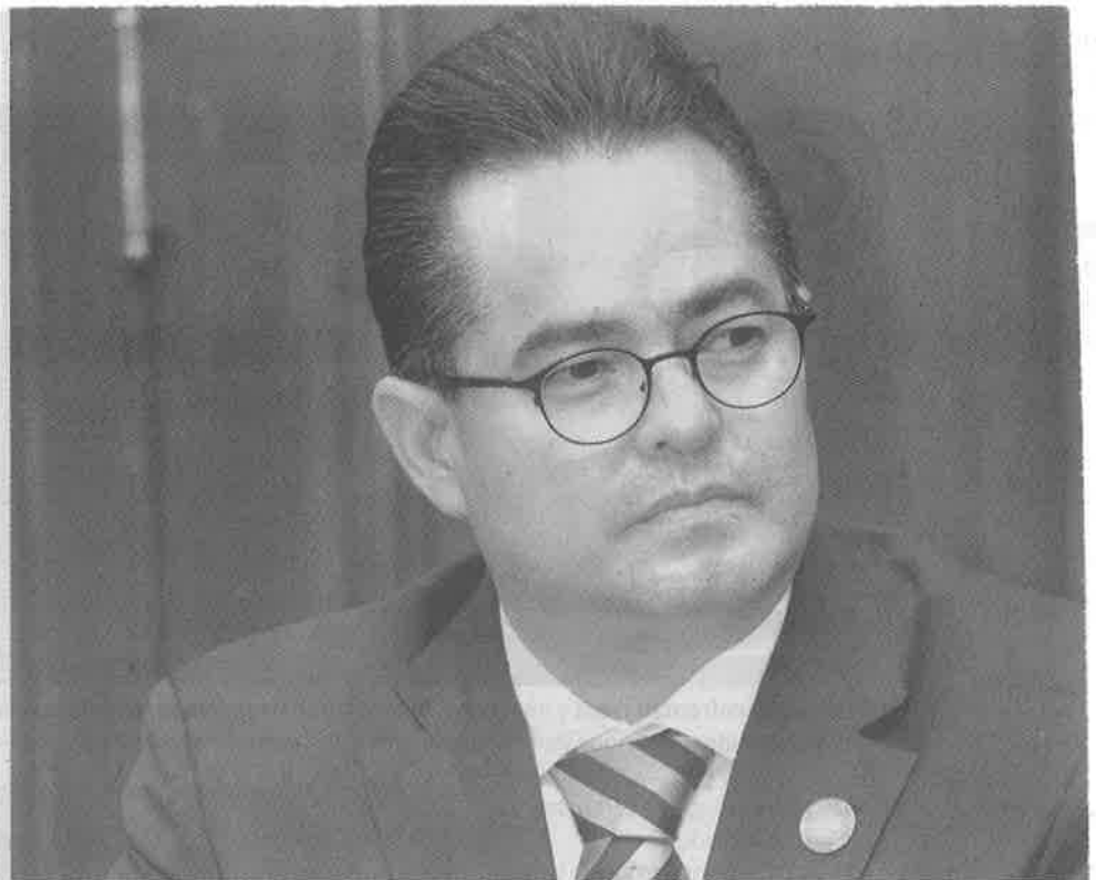
Leonel Luna Estrada, presidente de la Comisión de Gobierno de la ALDF. Vigorosa reiteración

Adicional a la Pensión Alimentaria como parte del programa integral el gobierno de Mancera ha impulsado visitas médicas, de educadoras, cuidadoras, turismo social, exhibición de películas entre muchas otras actividades.