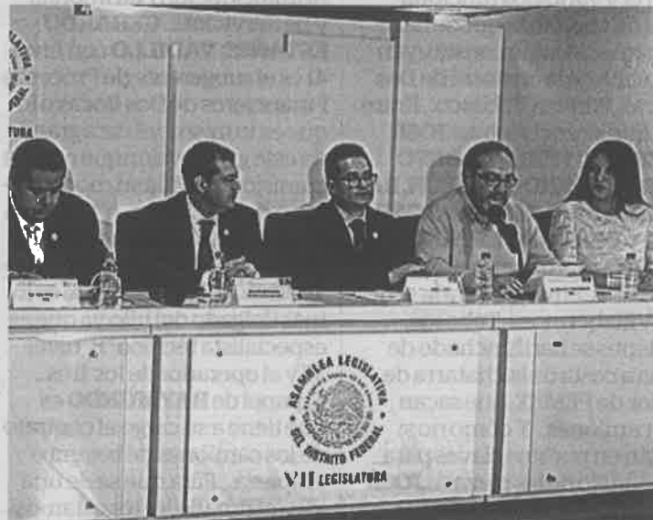
Proponen aprovechar pérdidas de alimentos

Toledo recordó que la ALDF ya avanzó en la Ley para la Donación Altruista de Alimentos , que busca promover, orientar y regular las donaciones de alimentos y evitar su desperdicio injustificado. En tanto, la reforma a la Ley de Adquisiciones busca crear la figura de Proveedor Alimentario Social que se fundamenta en el artí-