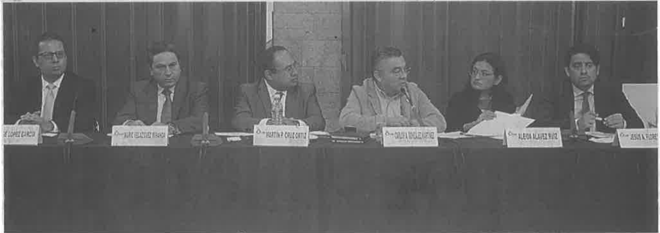
LA CONTRALORÍA capitalina dio el informe respecto del ejercicio de los recursos del Presupuesto Participativo 2015.