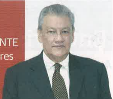
Por Francisco Cárdenas Cruz