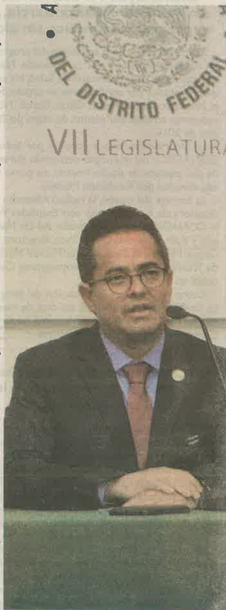
Que la CDMX reconozca el trabajo formal y no asalariado.

Recalcó, "frente a esta realidad, hay avances en materia de política social y económica, pero falta camino por recorrer, y la Constitución Política de la Ciudad de México es una oportunidad para impulsar derechos que mejoren la calidad de vida de los capitalinos, tarea en la que la ALDF colabora de manera activa".