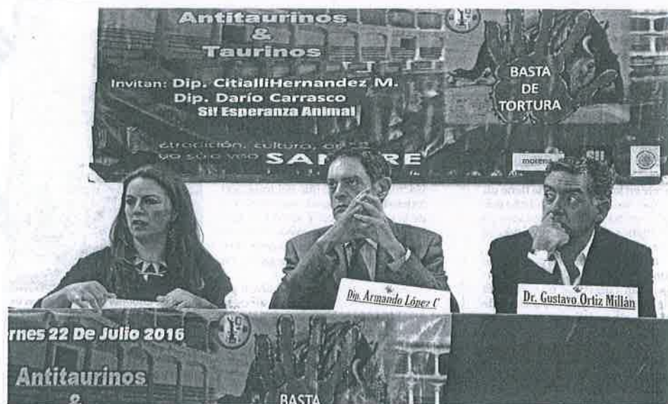
Los taurinos consideran que disfrutar de las corridas de toros no los hace perversos, crueles, sicópatas o sádicos. Por su parte, los opositores acusan que se privilegia el dinero antes que la vida del toro y el torero.

Activistas antitaurinos señalaron como situación decepcionante que diputados de Morena comprometidos a apoyar su lucha se ausentaron del foro que llevó dos meses en preparar. ●