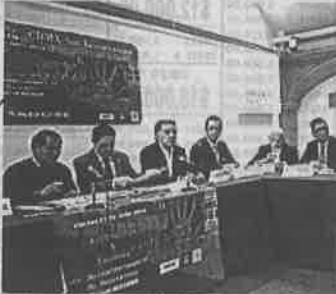
Debaten sobre tauromaquia

El legislador local de Morena reconoció que su bancada no estuvo muy convencida de brindarle el apoyo, por