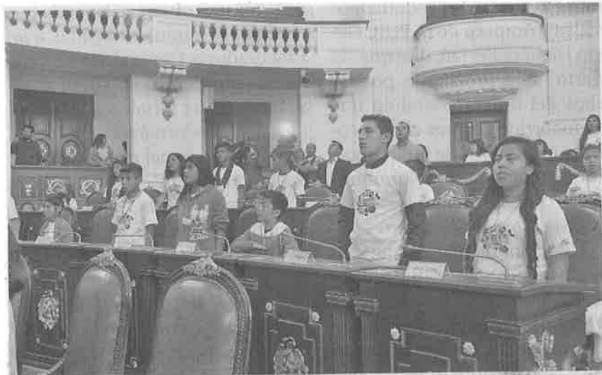
CELEBRACIÓN DEL Parlamento Incluyente Infantil y Adolescente que se llevó a cabo en la Asamblea Legislativa del Distrito Federal.

El Parlamento Infantil, aseguró, cumplió con su objetivo, al generar nuevas propuestas e ideas que el sector más vulnerable considera de mayor importancia para el desarrollo y crecimiento del país.