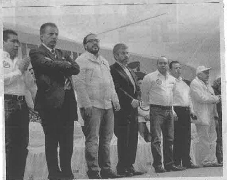
No incluirlos podría dar como resultado el fin del PRD