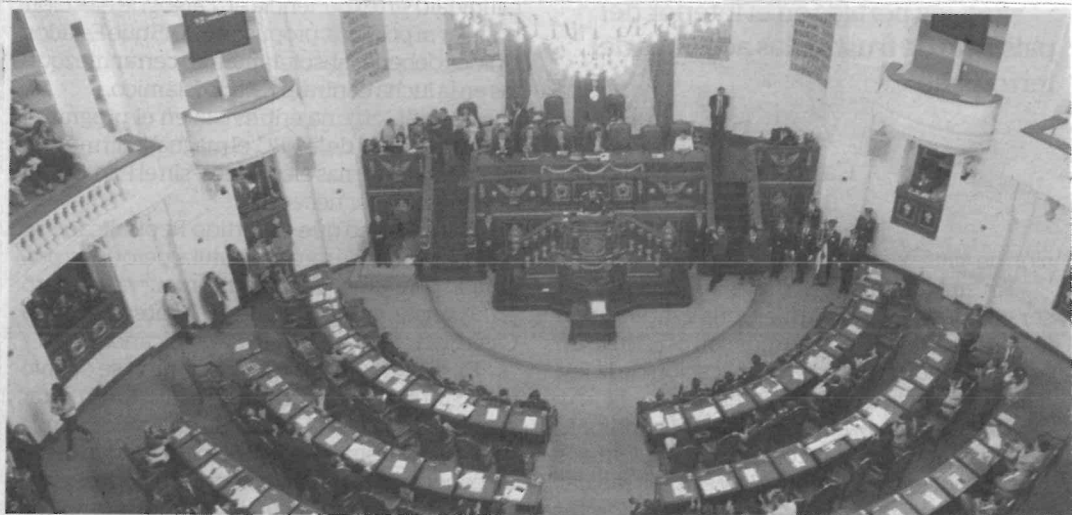
Diputados locales denunciaron falta de equidad en el manejo de la asignación, por lo que exigieron se aclare esto.