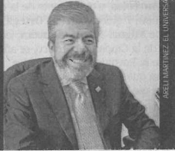
ARELI MARTÍNEZ, EL UNIVERSAL