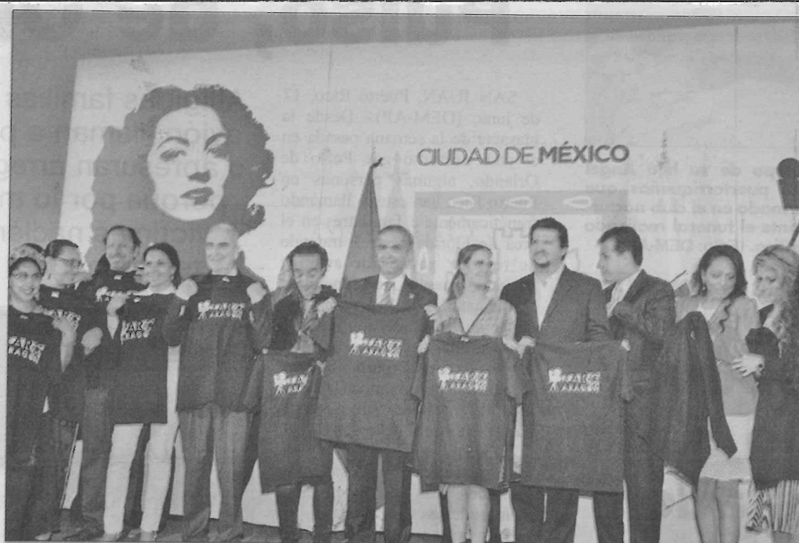
El jefe de gobierno de la Ciudad de México, Miguel Ángel Mancera, inauguró el Faro Aragón, que se convertirá en un lugar de apoyo permanente al cine mexicano y al talento de todos los que participarán en actividades de este espacio recuperado.