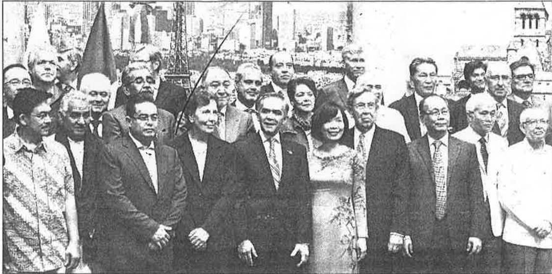
Desde antes de las 10 de la mañana decenas de personas esperaban la apertura de la Feria de las Culturas Amigas, la cual fue inaugurada por el titular del Ejecutivo local, Miguel Ángel Mancera, en la sede del gobierno