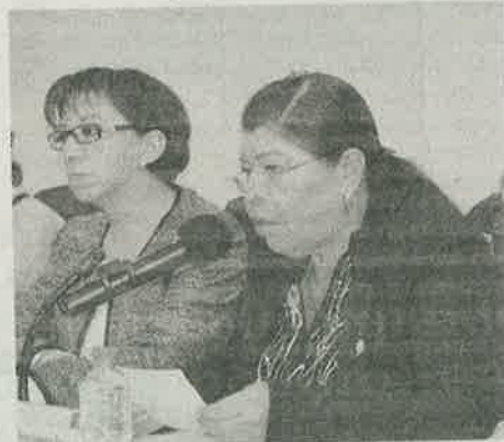
Ante la carencia del Proyecto Ejecutivo que exige la Ley, se deben suspender obras que se ejecutan en Álvaro Obregón y Cuajimalpa

Aseguró que las áreas de este tipo están sujetas a regímenes especiales de protección, conservación, restauración y desarrollo, porque generan servicios ambientales como la recarga de mantos acuíferos, captura de CO2 y partículas suspendidas, así como oportunidades de recreación para visitantes.