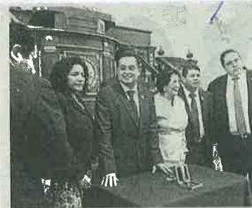
Guadalupe Rivera en la ALDF

no, por sus aportaciones políticas, culturales, sociales y altruistas a la sociedad. Las distintas bancadas reconocieron la larga trayectoria de la escritora y política Guadalupe Rivera, al ser tres veces diputada federal, senadora y delegada en A. Obregón. El