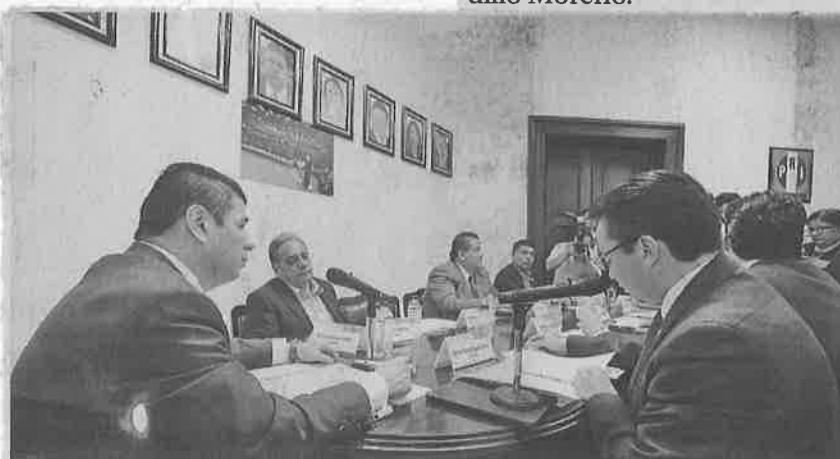
REUNIÓN DE trabajo de los legisladores.