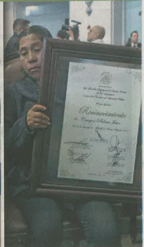
GALARDONADOS. Agentes de diversas corporaciones recibieron ayer la Medalla al Merito Policial 2015.