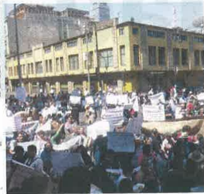
» Comunereros apoyan Tren Interurbano y acusan a Morena de impulsar oposición.

Hasta el cierre de esta edición, estos fueron algunos momentos de la última sesión del segundo periodo ordinario.