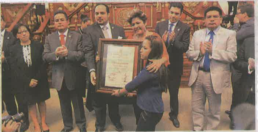
FAMILIARES DE policías caídos en el cumplimiento de su deber también recibieron el reconocimiento post mortem.