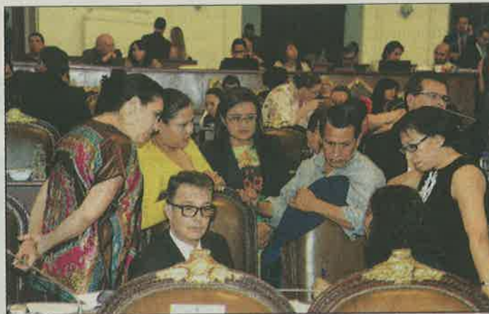
El grupo de trabajo está integrado por siete diputados, dos de ellos eran de Morena.

Explicó que esta medida no es mediática, sino que se apega a lo que marca el artículo 24 de la Ley Orgánica de la ALDF, el cual señala que el diputado que no asista a reuniones de comi-