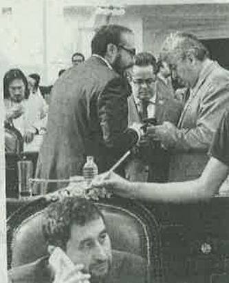
Por ser diputados faltistas

A un día de que la Comisión de Gobierno acordara con la fracción morenista una mesa de trabajo para definir qué comisiones integraría, el pleno aprobó eliminar de la Comisión de Normati-