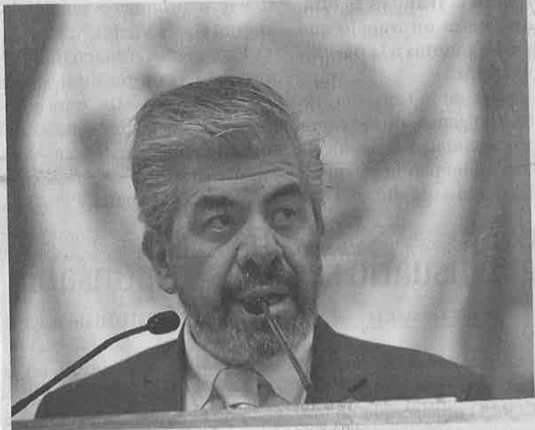
RAÚL FLORES García, presidente del Partido de la Revolución Democrática en el Distrito Federal.