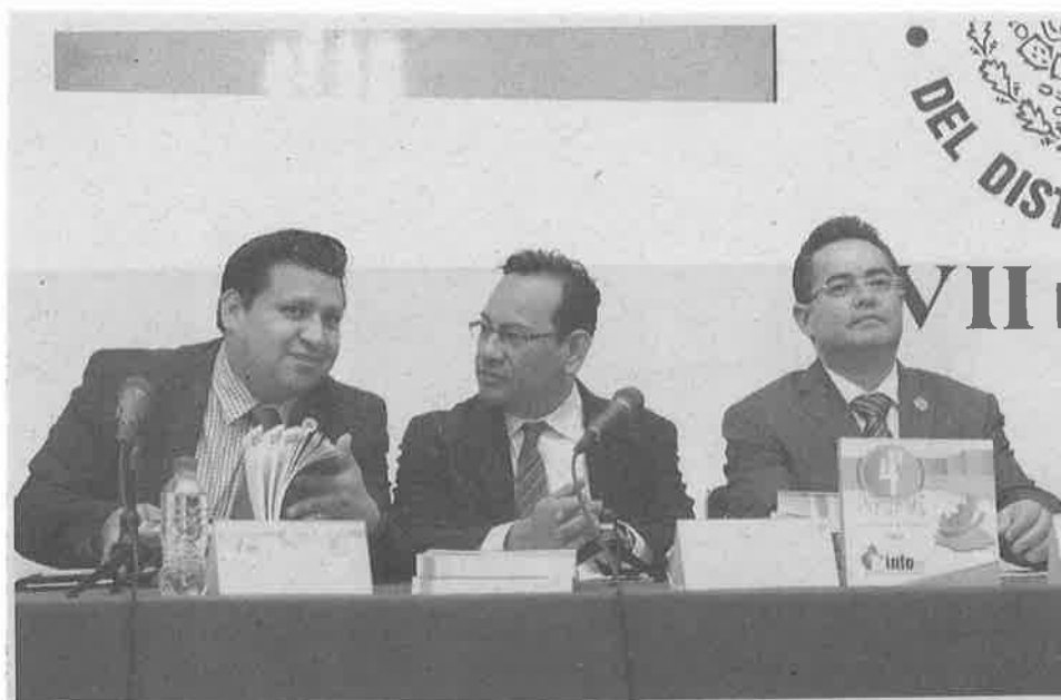
⊕ Se creará un consejo consultivo en el que participará la sociedad civil.

Se propone, también, un capítulo de gobierno abierto a fin de que el Info-DF contribuya con representantes de la sociedad civil en la promoción de políticas de apertura gubernamental.