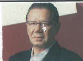
Razones JORGE FERNÁNDEZ MENÉNDEZ

www.excelsior.com.mx/jfernandez www.mexicoconfidencial.com