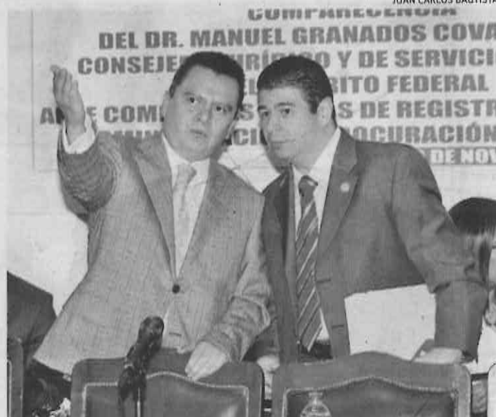
El consejero Jurídico en la Asamblea Legislativa.