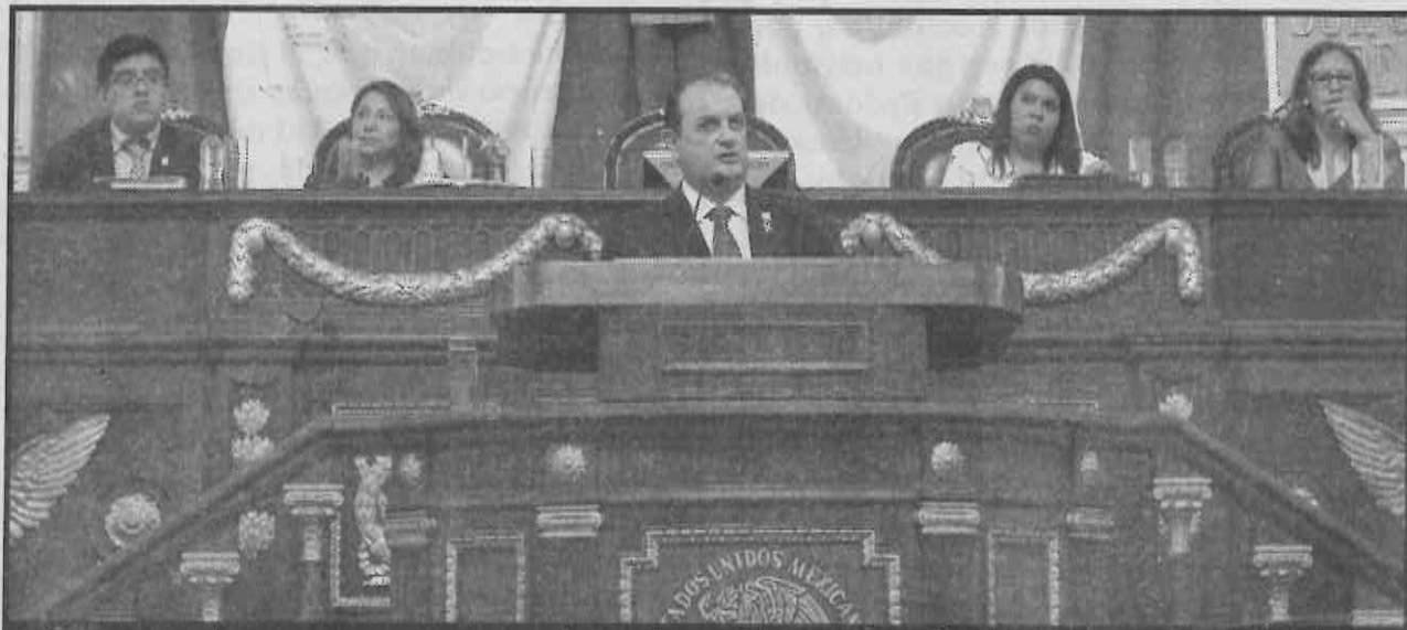
Compromiso con sectores más vulnerables: Ríos Garza ante asambleístas