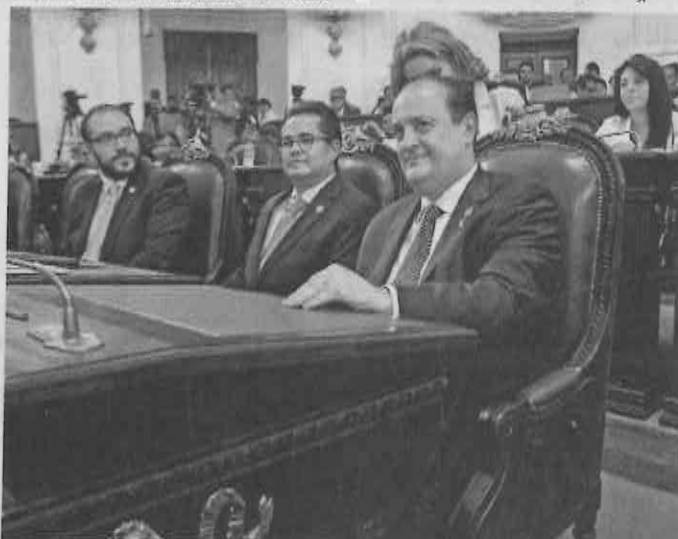
El procurador capitalino, Rodolfo Ríos Garza, compareció ayer ante la Asamblea Legislativa del DF.

Según sus estadísticas, aclaró, el robo a transporte con o sin violencia bajó 1.1%; el robo a negocios con violencia, 5.5%, el robo a transeúnte, 11.9%, el robo a casa-habitación, 12.3%; y las lesiones por disparo de arma de fuego 17.1%. ●