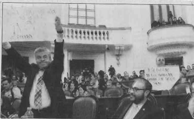
DUELO. Una vez más PRD y Morena se enfrascaron en acusaciones.