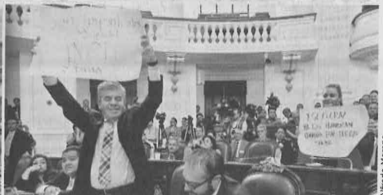
CARTULINAZO. Con pancartas, diputados de Morena y PRD cruzaron acusaciones durante la comparecencia del Jefe de la Policía.