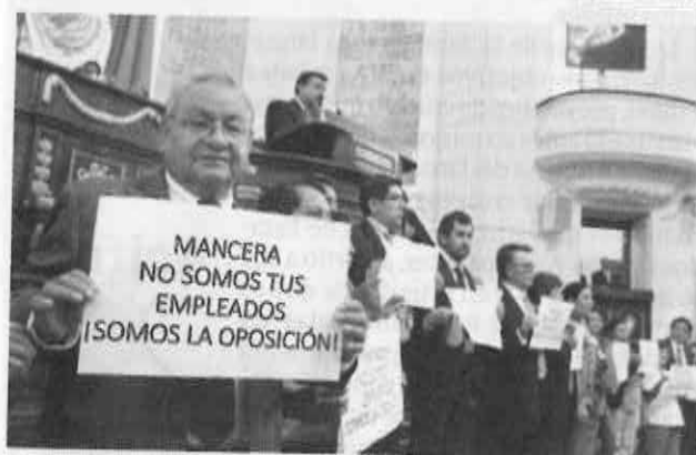
ASAMBLEÍSTAS de Morena manifestándose en la ALDF, ayer.