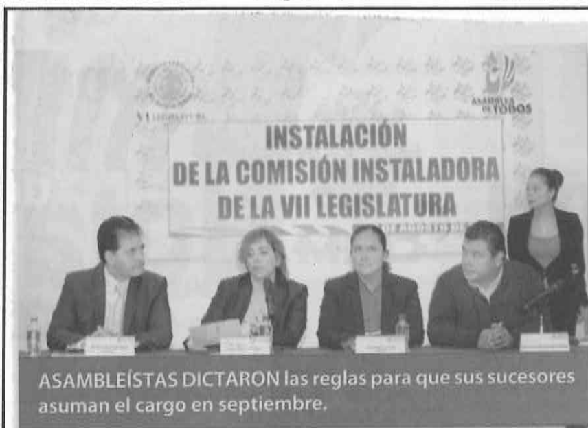
ASAMBLEÍSTAS DICTARON las reglas para que sus sucesores asuman el cargo en septiembre.