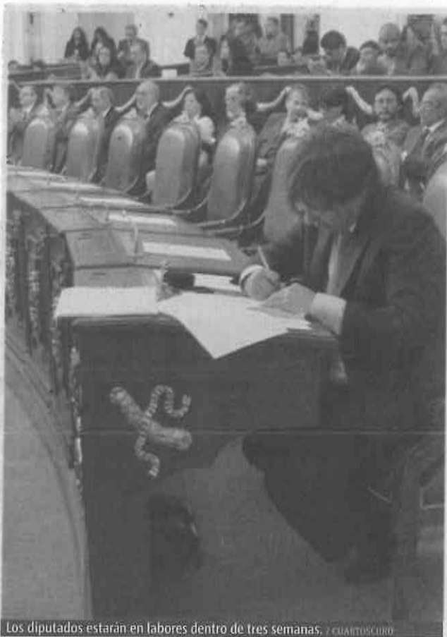
Los diputados estarán en labores dentro de tres semanas.