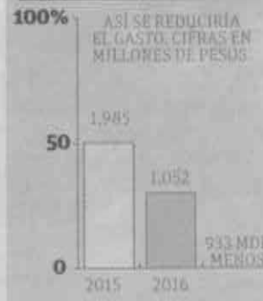
Presupuesto de la ALDF

cir el sueldo a los legisladores, los diputados de Morena donarán 50% de su sueldo (el cual asciende a 57 mil pesos al mes) para actividades educativas.