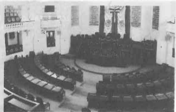
El 15 de septiembre inicia la VII legislatura.

nuevas plazas de asesoría de alto nivel fueron creadas