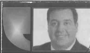
TONATIUH GONZÁLEZ CASE