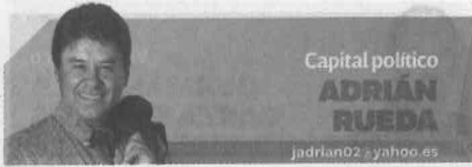
Capital político ADRIÁN RUEDA