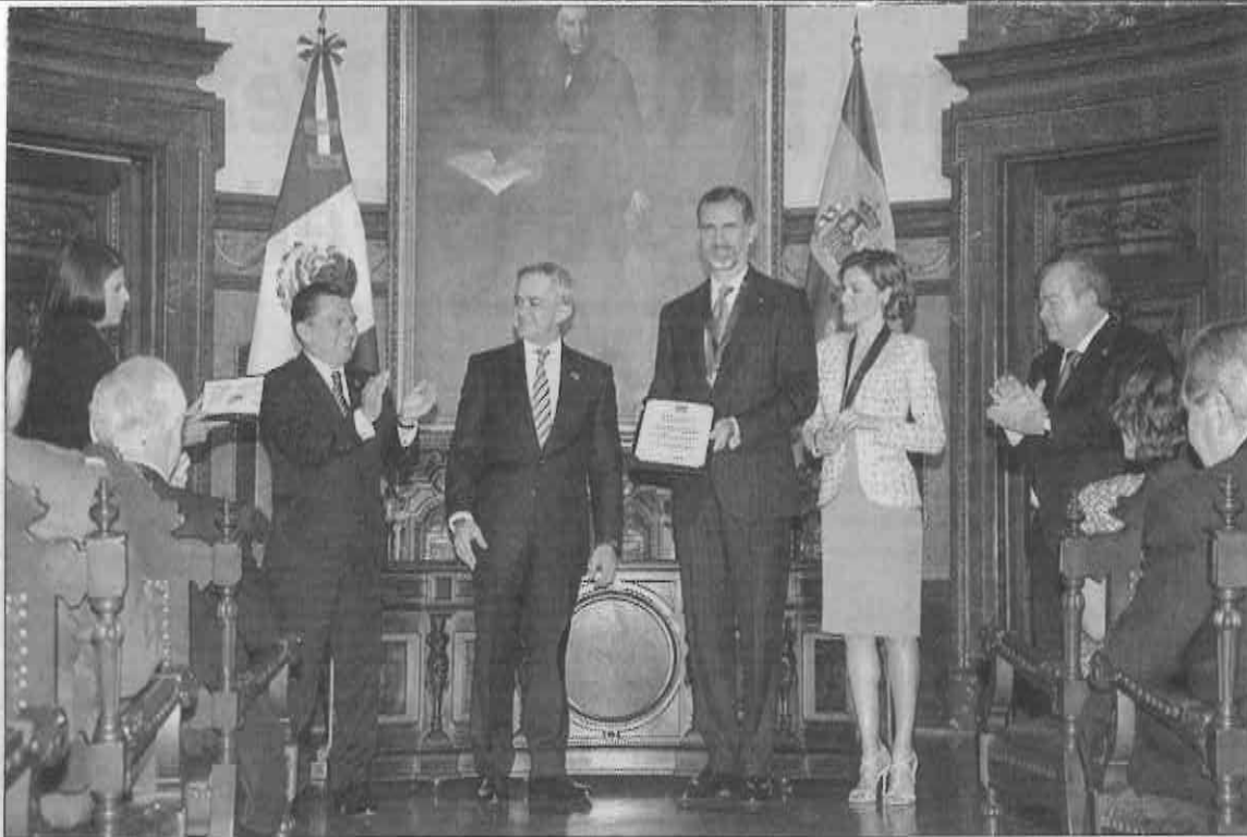
Miguel Ángel Mancera, jefe de gobierno del Distrito Federal, nombró huéspedes distinguidos a los reyes de España. En el acto el mandatario local destacó la historia, el idioma, principios, valores y aspiraciones que se comparten con esa nación. Más tarde anunció la inversión de 575 millones de pesos para la compra de 220 autobuses RTP y los detalles para la construcción de la Línea 7 del Metrobús.