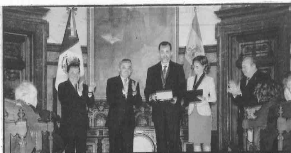
Miguel Angel Mancera otorgó las Llaves de la Ciudad