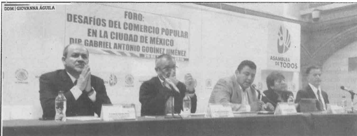
El foro "Desafíos del Comercio Popular" se llevó a cabo en la Asamblea Legislativa del Distrito Federal.