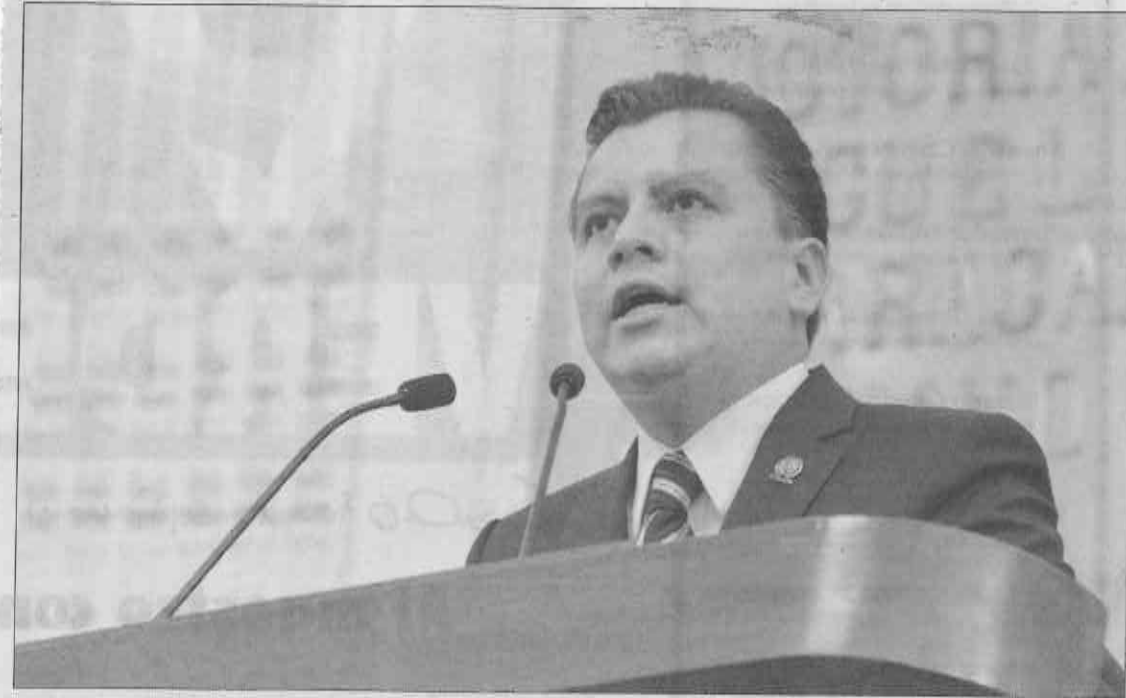
En el marco del Día Internacional de los Museos, el presidente de la Comisión de Gobierno de la Asamblea Legislativa del DF, diputado Manuel Granados, destacó el compromiso de este órgano por impulsar la cultura en la CDMX, entidad con más museos en el país.