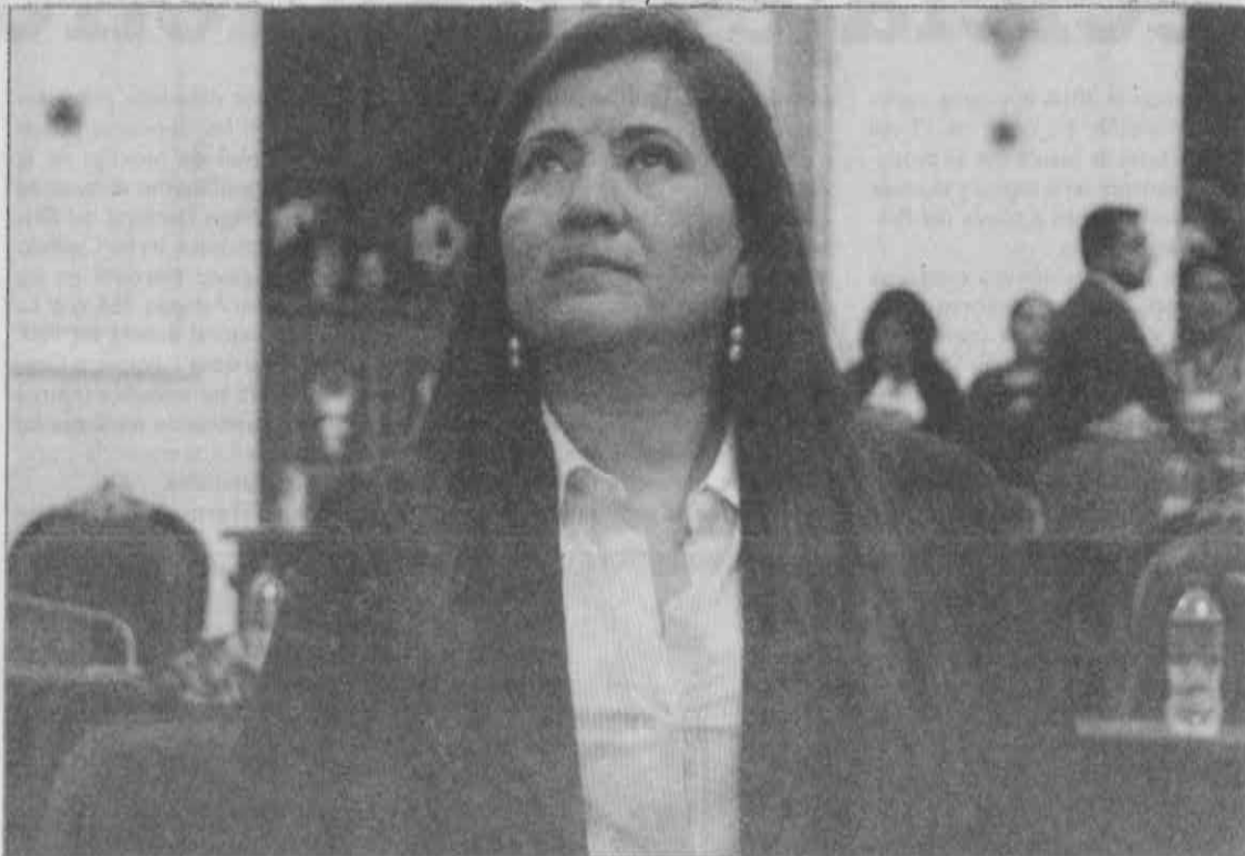
Antes de privatizar el agua, se deben buscar métodos sustentables como la captación de agua pluvial.

Recalcó que los recursos del presupuesto participativo se pueden utilizar los mil 793 comités vecinales como sustentabilidad para la captación de éste vital líquido; asimismo, instó a los legisladores locales de la VII legislatura dar seguimiento al tema y convertir dicha captación en política pública y obligatoria para departamentos gubernamentales, hospitales, escuelas, unida-