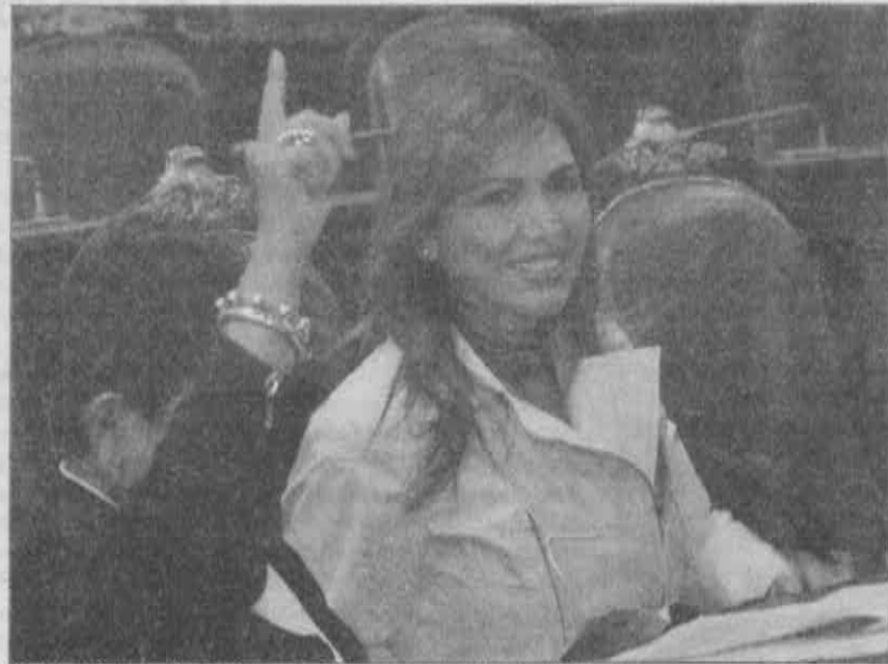
Nadie debe ser visto ajeno, se deben respetar los derechos de personas con orientación sexual diversa.

Refirió que casi 80 países en el mundo criminalizan la homosexualidad y condenan los actos sexuales entre personas del mismo sexo con penas de prisión, nueve de ellos, entre los que se encuentran Afganistán, Mauritania, Nigeria, Pakistán, Arabia, Emiratos Árabes y Yemen mantienen para estos casos la pena de muerte.