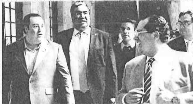
ELECCIONES LIMPIAS. Y pleno apego a la legalidad son los objetivos del pacto de civildad entre los partidos del Distrito Federal, por lo que la propuesta es para que se sumen todos los participantes.

"No está en mi cancha, que si no lo firman, pues ni modo. Ahora sí que fue como las campanadas, quien quiera acudir que acuda y quien no quiera acudir pues que no acuda", enfatizó. ☺