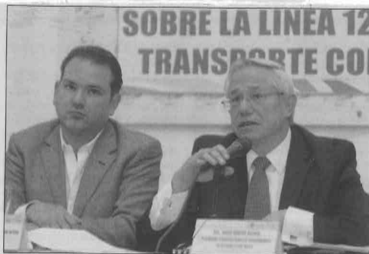
INFORME. El documento fue aprobado con siete votos a favor y uno en contra.

También los diputados recomendaron crear los laboratorios y proyectos de investigación en tecnología ferroviaria de la ciudad de México, en las escuelas ESIA, UPIICSA, ESIME del IPN; en la Facultad de Ingeniería de la UNAM y en la UACM. (Manuel Espino Bucio)