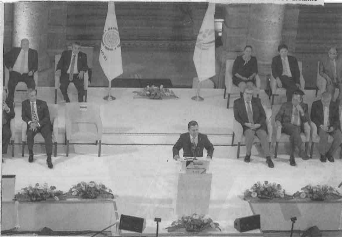
Manuel Granados Covarrubias, Presidente de la Comisión de Gobierno de la Asamblea Legislativa del Distrito Federal, tuvo un gran poder de convocatoria durante su 2o. Informe de Actividades al que asistió el jefe de gobierno, Miguel Ángel Mancera. El asambleísta destacó, entre otros logros, el 94% de consenso en la votación de iniciativas y un 100% en transparencia.

Al respecto, resaltó la aprobación en el Pleno de 400 dictáme-