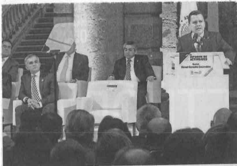
Manuel Gradados, presidente de la Comisión de Gobernación de la Asamblea Legislativa del DF, presentó ayer su segundo informe legislativo.

Al agradecer la asistencia de "amigos y amigas", pese a ser egresado de la Universidad Nacional Autónoma de México (UNAM) una porra política dio por concluido el informe de Granados Covarrubias. ●