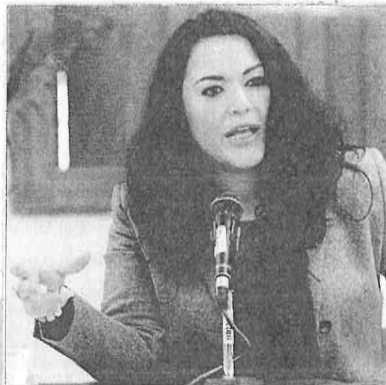
» DINORAH PIZANO Osorio, presidenta de la Comisión de Derechos Humanos de la Asamblea Legislativa.

"Estamos satisfechos con este logro alcanzado y reconocemos que los esfuerzos de prevención nunca son suficientes, por lo que siempre hay algo nuevo que aportar a fin de maximizar los logros", finalizó.