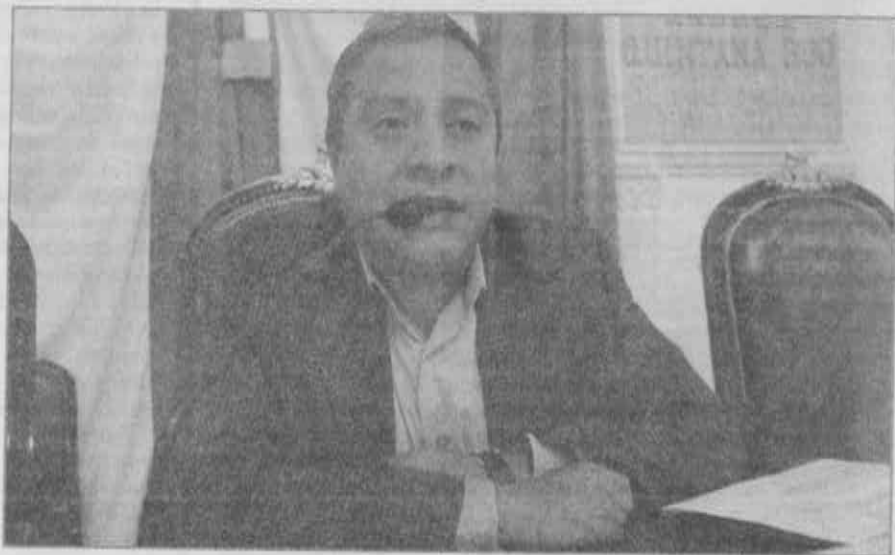
Debe CDHDF investigar violación a los derechos humanos en materia laboral.

Mencionó que el peor dato en materia laboral se encuentra en la cuestión relativa a la informalidad laboral, pues aún en el Distrito Federal millones de empleos no se apegan a la categoría del "trabajo digno", todo ello debido a las políticas implementadas por los gobiernos federales priistas y panistas.