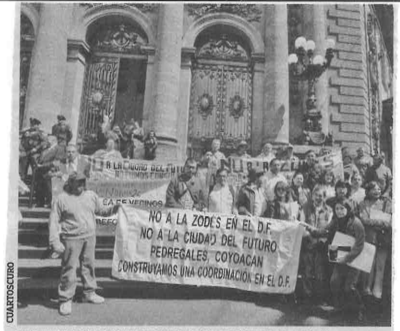
En la ALDF, vecinos y organizaciones se han manifestado contra la Norma.

Ley polémica y criticada Desde hace meses, vecinos y organizaciones han criticado la Norma 26, asegurando que hace falta mejorar dicha ley.