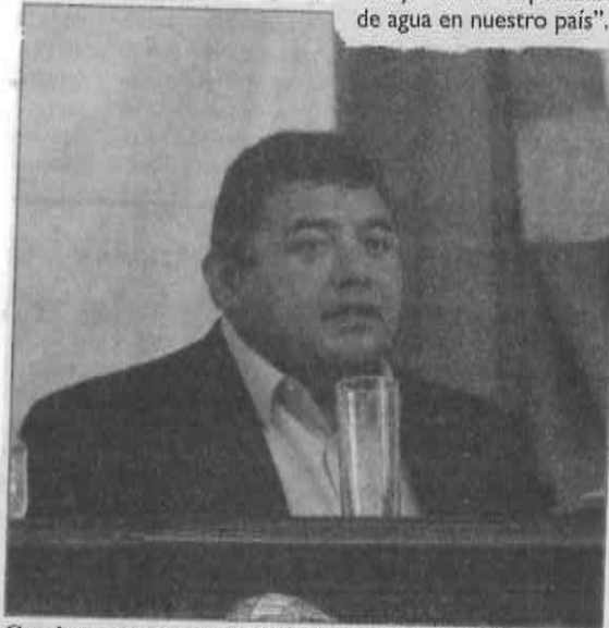
Con intento de aprobación de la LGA, se busca favorecer a empresas en detrimento de la sociedad.

Apuntó, que "de ahí la importancia de no quedar al margen de ningún debate nacional y capitalino, porque los graves desequilibrios económicos que implican una alta concentración de la riqueza en una pequeña franja poblacional tienen su reflejo en la disponibilidad de agua en nuestro país".