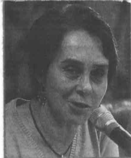
Por violación a norma 26, piden cabeza de funcionario de Seduvi.

Asimismo, se aprobó el requerimiento del 20% de cajones de estacionamiento, que equivale a 9 espacios de estacionamiento, clasificándose las 44 viviendas dentro de la categoría "A", condicionando al total cumplimiento de las medidas de sustentabilidad presentadas en el proyecto.