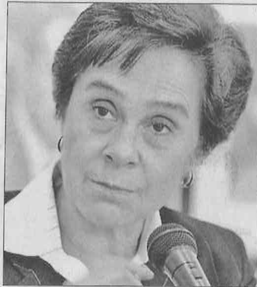
» MARÍA DE los Ángeles Moreno, ex-presidenta del Senado.