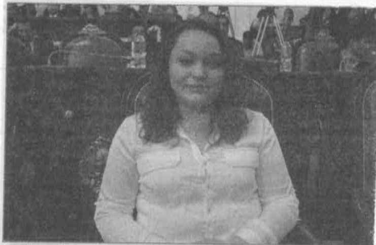
La educación y opciones de un mejor futuro profesional para los jóvenes es uno de los pendientes.

Además, vigilará también que el ejercicio de los prestadores de servicio social esté enfocado a la profesión que se cursó y no se utilice a los jóvenes sólo como mensajeros o actividades que no enriquecen su profesión ni ofrecen un verdadero beneficio a la sociedad.