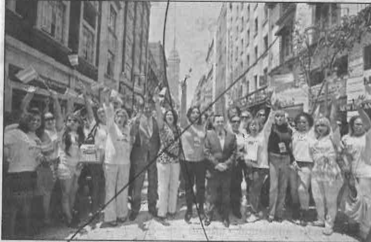
El presidente de la Comisión de Gobierno de la Asamblea Legislativa del Distrito Federal, Manuel Granados, asistió al primer Encuentro Nacional Transgénero. Aquí, en la esquina de Francisco I. Madero y Motolinía, en el Centro Histórico