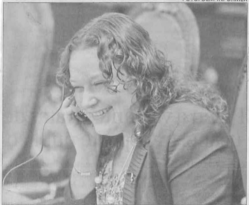
» LA PRESIDENTA de la Comisión de Educación en la Asamblea Legislativa del Distrito Federal (ALDF), Yuriri Ayala.