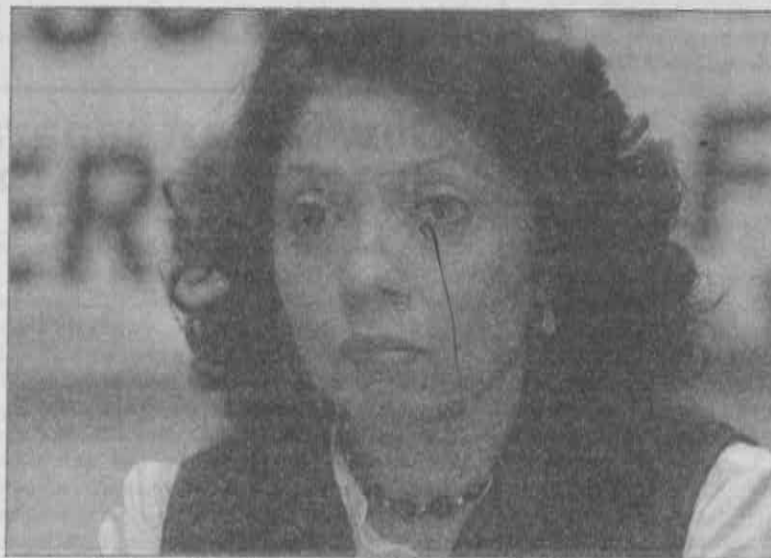
Incumplió Venustiano Carranza en materia de obras públicas.

La ASF recomendó a la delegación Venustiano Carranza instruir a quien corresponda, a efecto de implementar las acciones necesarias para que, en lo subsecuente, se atiendan las debilidades e insuficiencias determinadas en la evaluación del control interno, a fin de fortalecer los procesos de operación, manejo y aplicación de los recursos y apoyar el logro adecuado de sus objetivos.