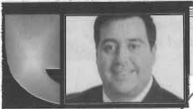
TONATIUH GONZÁLEZ CASE*