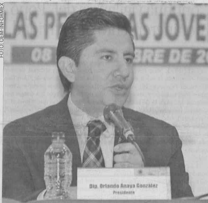
» EL ASAMBLEÍSTA panista Orlando Anaya.