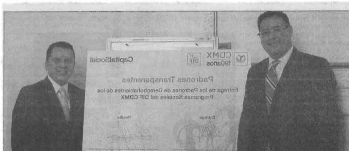
Ante las venideras elecciones entregan padrón de programas sociales.

Refirió que los padrones entregados serán publicados en la Gaceta Oficial del Distrito Federal y podrán ser consultados por las y los derechohabientes o el público en general en el portal del DIF Capitalino, www.dif.df.gob.mx .