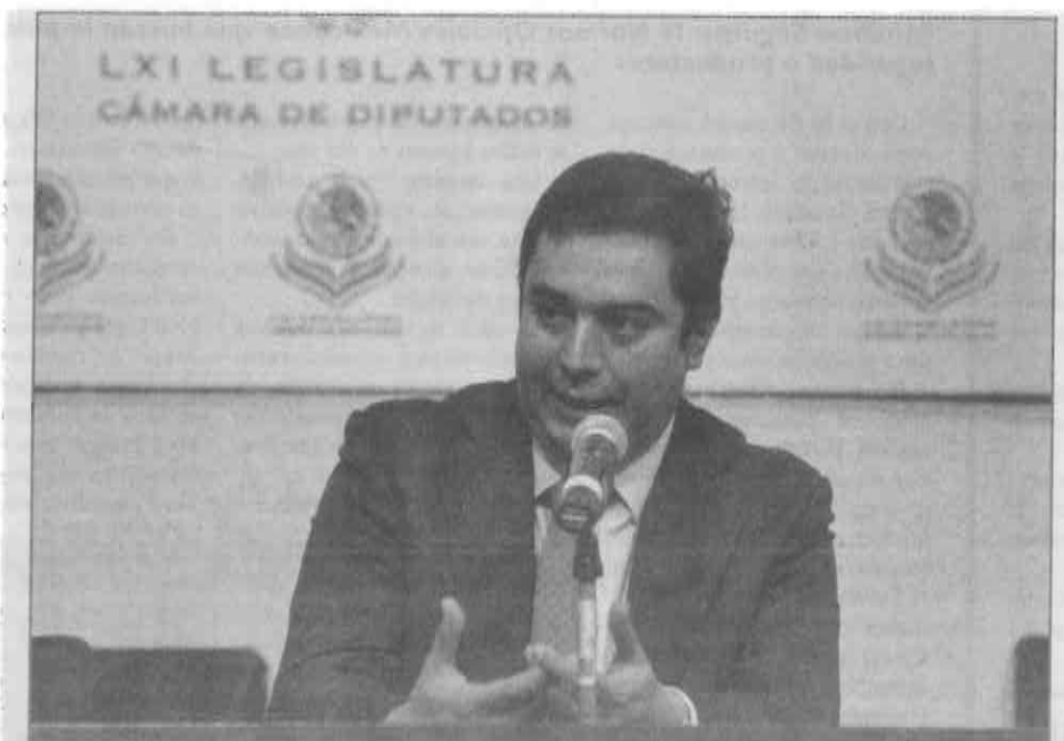
Debe de indagarse presunta entrega de despensas con fines electorales.

Dijo que "si EvalúaDF tiene informes y análisis sobre este tipo de programas, pediremos que nos los entreguen y de no tenerlos, estaremos solicitando que analicen dichos programas sociales y nos indiquen la pertinencia de los mismos en tiempos electorales".