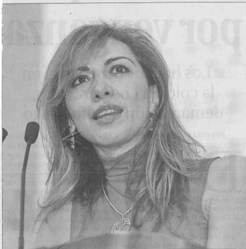
» MIRIAM SALDAÑA, presidenta de la Comisión de Vivienda de la Asamblea Legislativa del Distrito Federal.