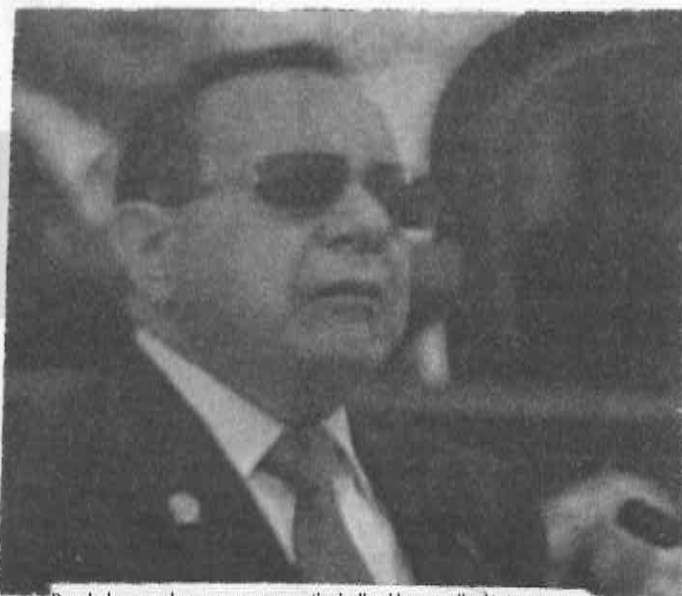
Derecho humano al agua es una prerrogativa inalienable por arriba de otros usos.

Agregó, el Senado de la República ratificó este pacto el 18 de diciembre de 1980, aceptando así las obligaciones para realizar progresivamente, y utilizando el máximo de los recursos disponibles, el derecho al agua para alcanzar un nivel de vida adecuado. El derecho al agua finalmente fue reconocido en 2012 en el artículo 4º constitucional, y hoy, enfatizó, está a punto de desaparecer.