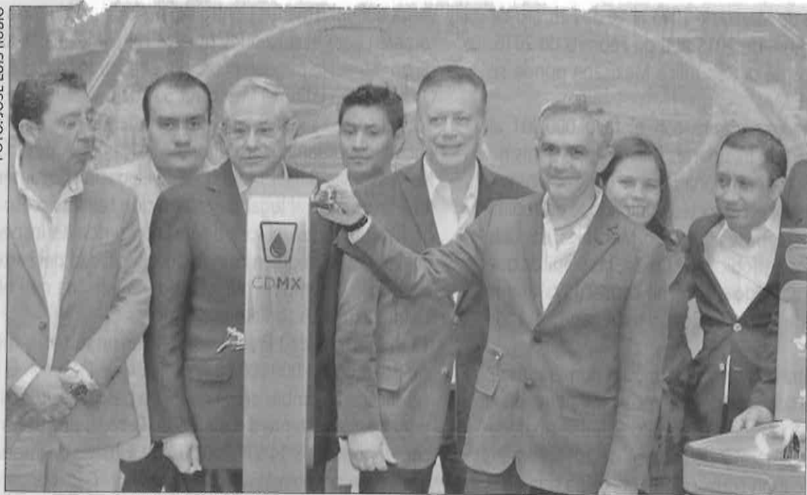
» MIGUEL ÁNGEL Mancera encabezó celebración por el Día Mundial del Agua.