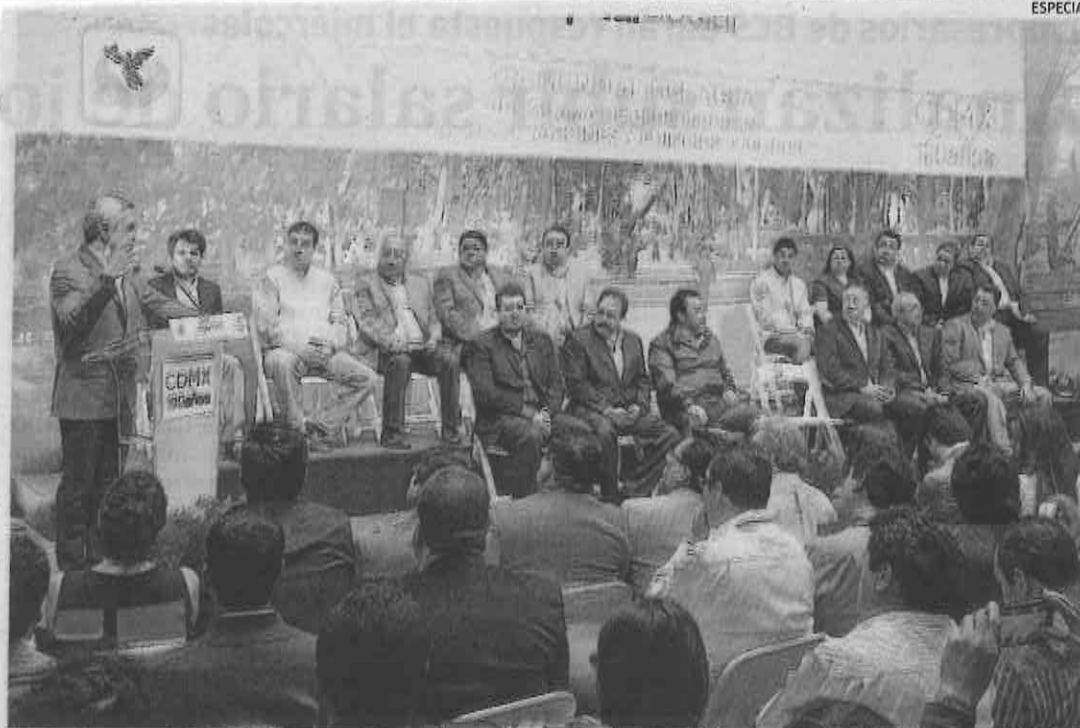
Miguel Ángel Mancera anunció que sitios públicos, como el bosque de San Juan de Aragón, tendrán abrevaderos.