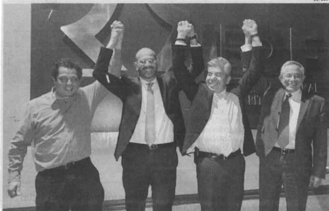
Los líderes partidistas celebran el acuerdo en el Instituto Electoral del DF.