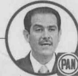
Guillermo Padrés Elías PAN