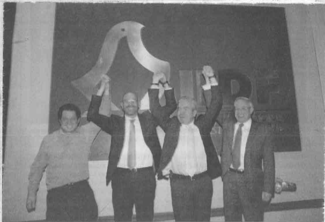
ACUERDO. Casi al cierre del registro hubo consenso.