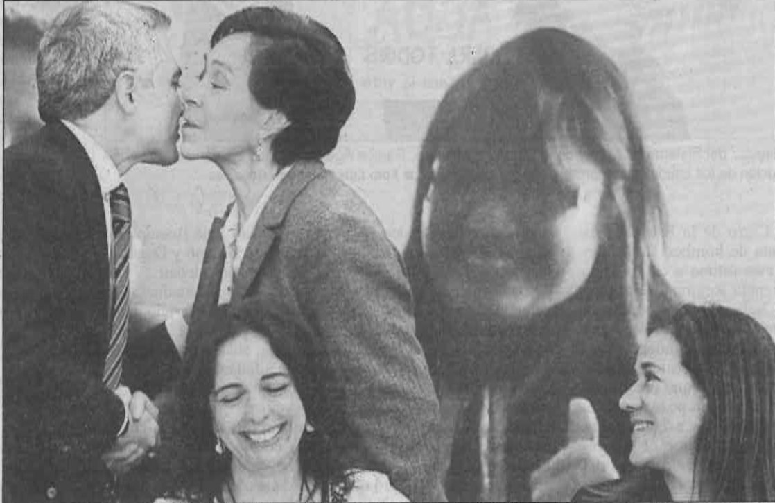
El jefe de Gobierno, Miguel Ángel Mancera, saluda a la diputada local priísta María de los Ángeles Moreno, en el acto-desayuno Empleadoras por los derechos de las trabajadoras de nuestros hogares. Observa la escena Margarita Zavala; a su lado, la periodista Maité Azuela