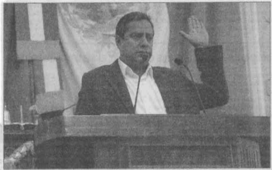
Debe de ponerse freno a los comerciantes encarecedores del huevo.

Insistieron en el llamado a la Profeco como a la Secretaría de Economía, para que en caso de que si se detecta un incremento injustificado, las sanciones que se apliquen a los productores sea las máximas posibles, que pueden llegar a los 3.8 millones de pesos por cada operación de venta.