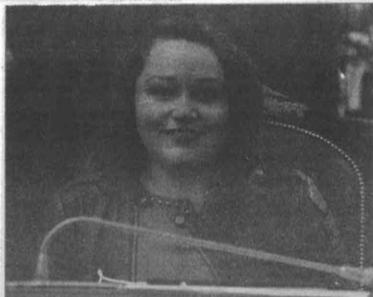
Ley de convivencia libre de violencia en escuelas, vital para combatir el bullying.

Agregó, siete de cada diez estudiantes han sido víctimas de la violencia escolar, de acuerdo con datos de la Comisión Nacional de Derechos Humanos (CNDH), que revelan que el número de menores afectados por este fenómeno aumentó 10% en los últimos dos años; además, estudios de la Universidad Nacional Autónoma de México (UNAM) y del Instituto Politécnico Nacional (IPN) señalan que entre 60 y 70% de los estudiantes en el nivel preescolar, primaria y secundaria han sufrido bullying.