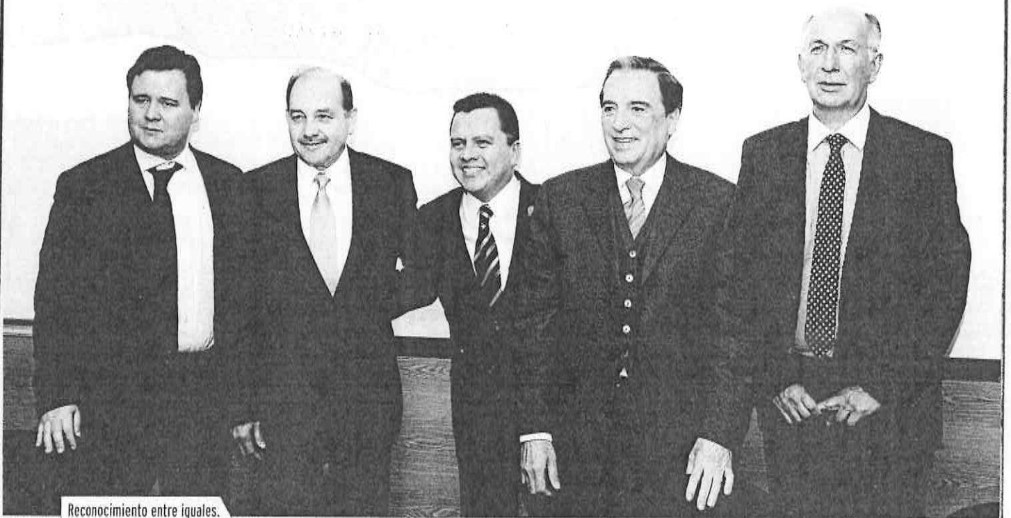
Reconocimiento entre iguales.

“La principal responsabilidad es conservar el equilibrio de todas las fuerzas políticas para bien de la Ciudad de México.”