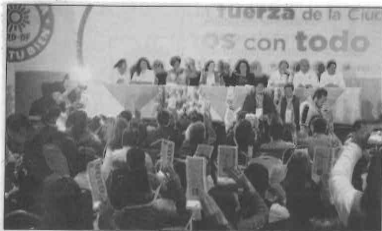
Diversas corrientes se disputan diputaciones y demarcaciones.