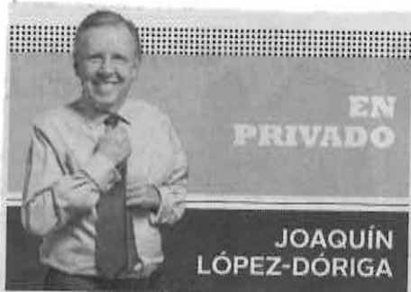
EN PRIVADO JOAQUÍN LÓPEZ-DÓRIGA