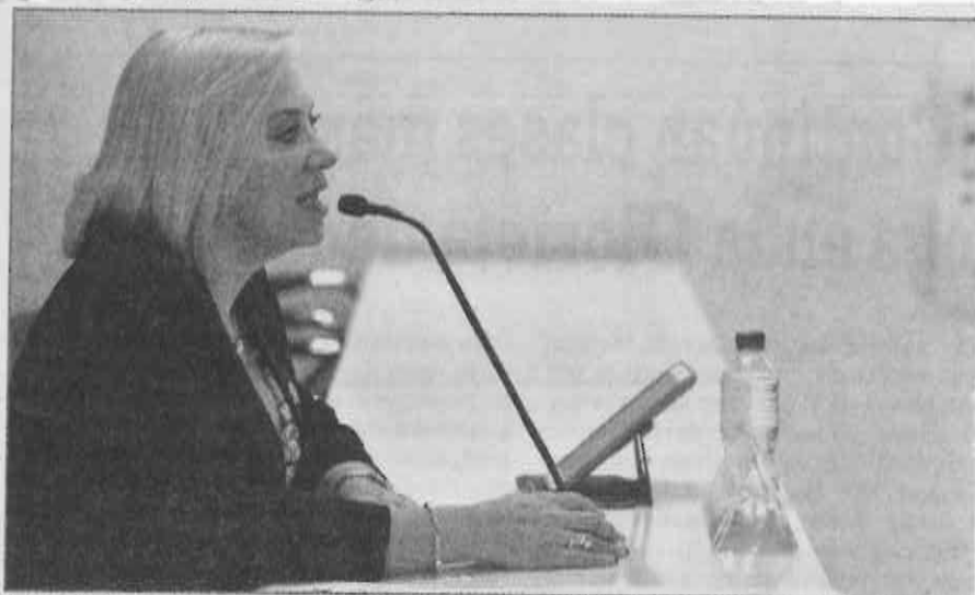
Las personas deben conocer sus derechos para hacerlos valer.

Apuntó, "como lo hemos venido comentando, nosotros los que estudiamos en el pasado, no estudiamos juicios orales, no nos enseñaron el tema de argumentación jurídica que será muy importante