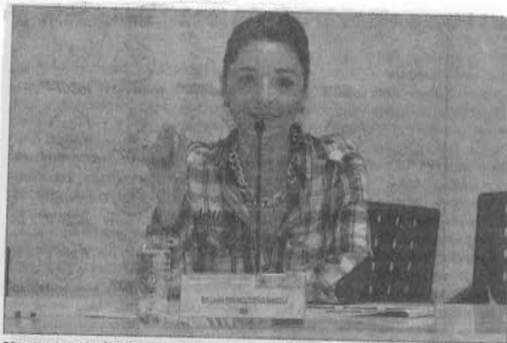
Urge trabajo conjunto de los tres niveles de gobierno para rescatar de crisis al Metro.

federal, tomen cartas en el asunto para que se cree un fondo que a cinco años rescate financieramente el Metro de la ciudad y garantice la seguridad de todos los usuarios".