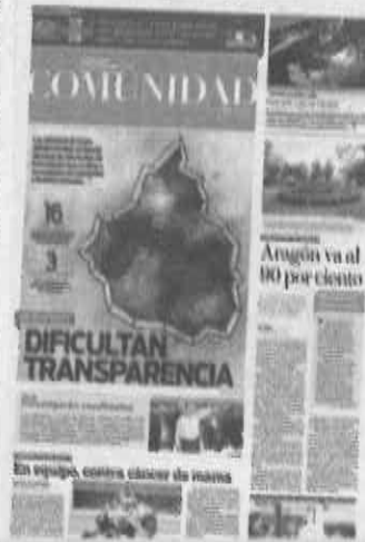
En octubre pasado, Excélsior publicó que los portales de las delegaciones son limitados.