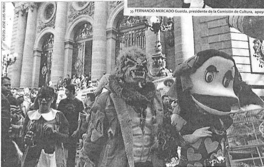
» CERCA DE seiscientos carnavaleros provenientes de las dieciséis delegaciones se dieron cita afuera del recinto legislativo para expresar sus demandas.