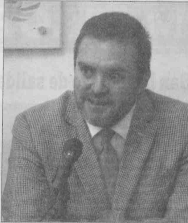
Quieren conocer currículo y planes emergentes de encargados de los despachos de las 14 delegaciones de extracción perredista.

En este sentido, el líder de la banca blanca citó la opinión de Eduardo Huchim, analista político y exconsejero del IEDF, quien señaló que sería la primera vez que 14 funcionarios renuncian en bloque, lo cual podría generar un riesgo de des-