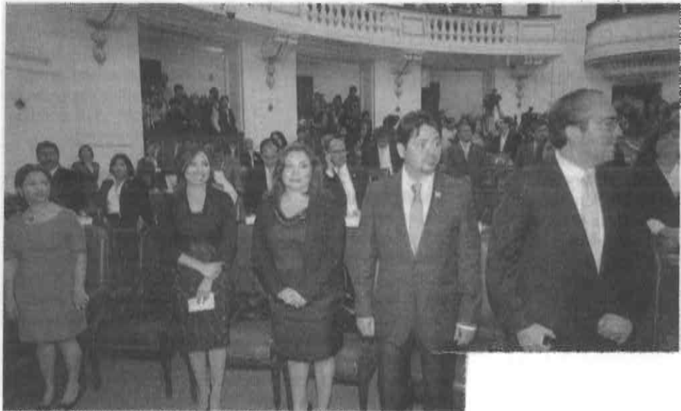
HÁBITO. Algunos ya tienen experiencia en 'saltar' de cargo.