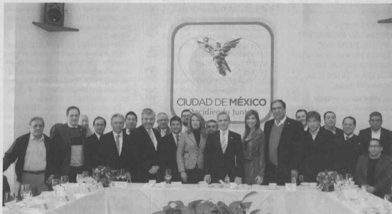
Miguel Ángel Mancera se reunió ayer con representantes de todos los partidos políticos, para abordar temas sobre el próximo proceso electoral y retomar su propuesta de que los candidatos se sometan a exámenes de control y confianza.