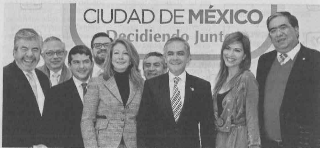
■ Miguel Ángel Mancera se reunió con los líderes de todos los partidos en el DF.

"Todos los partidos políticos coincidieron en que deben buscarse alternativas que den certeza respecto a las y los candidatos eliminando posibilidad de que estén vinculados a actividades ilícitas", dice un comunicado.