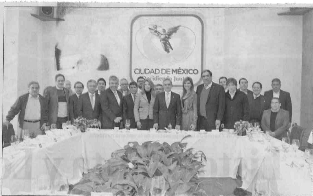
» LA REUNIÓN entre los dirigentes de los partidos con el jefe de Gobierno, Miguel Ángel Mancera, duró más de dos horas y fue privada.