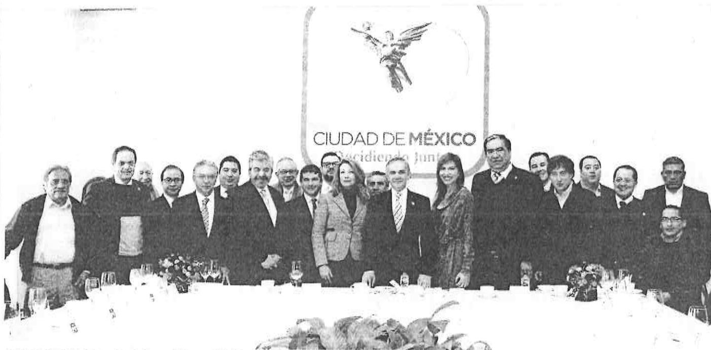
COMPROMISOS. Dirigentes de diez partidos en el Distrito Federal se reunieron con el jefe de Gobierno capitalino.

Miguel Ángel Mancera Jefe de Gobierno del DF