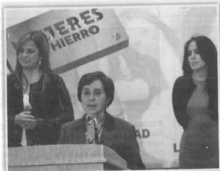
En el PRI-DF surgió el grupo 'Mujeres de Hierro', derivado de las acusaciones.