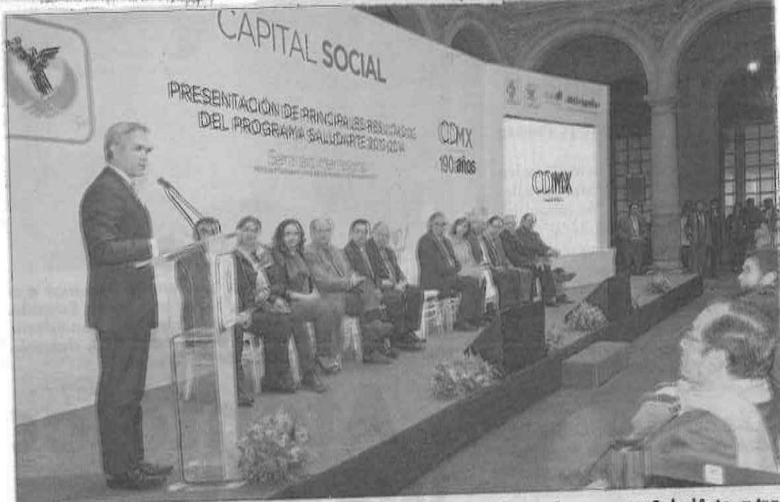
El jefe de gobierno capitalino, Miguel Angel Mancera, señaló que el programa SaludArte, a través de dietas nutritivas y actividades culturales y artísticas, ha mejorado los hábitos alimenticios y reducido la obesidad en niñas y niños de escasos recursos en escuelas primarias del DF.