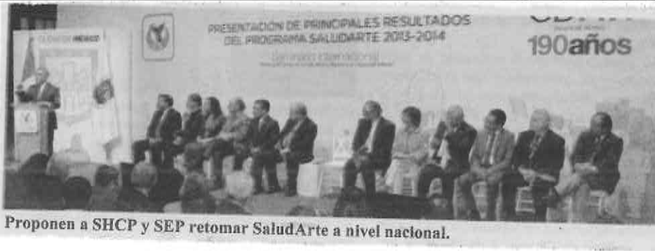
Proponen a SHCP y SEP retomar SaludArte a nivel nacional.