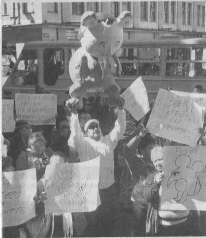
■ Ayer un grupo de vecinos de Coyoacán exigieron frente a la ALDF castigar al diputado Édgar Borja.

“El buen juez por su casa empieza. Estamos conscientes de la importancia de enviar el mensaje a los ciudadanos de confianza y credibilidad de nuestros miembros”, agregó.