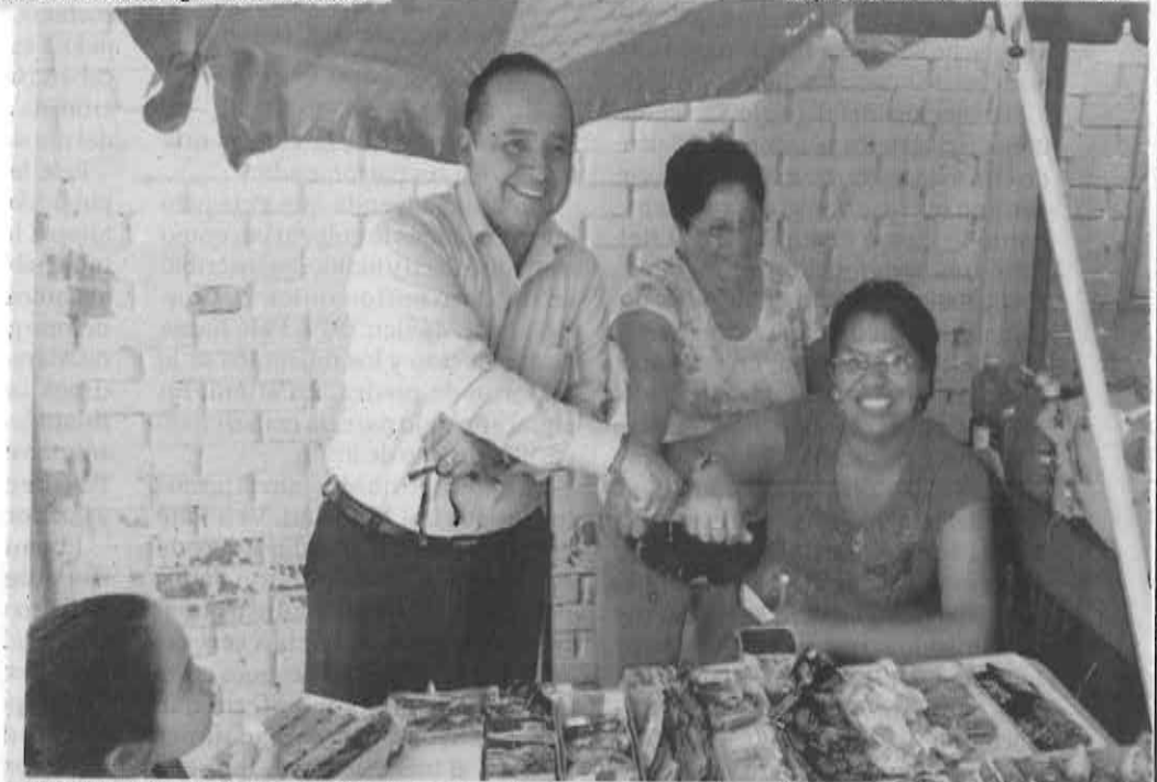
El legislador capitalino convive con comerciantes en imagen de archivo.

Podrá reincorporarse al grupo parlamentario o como legislador independiente: Döring