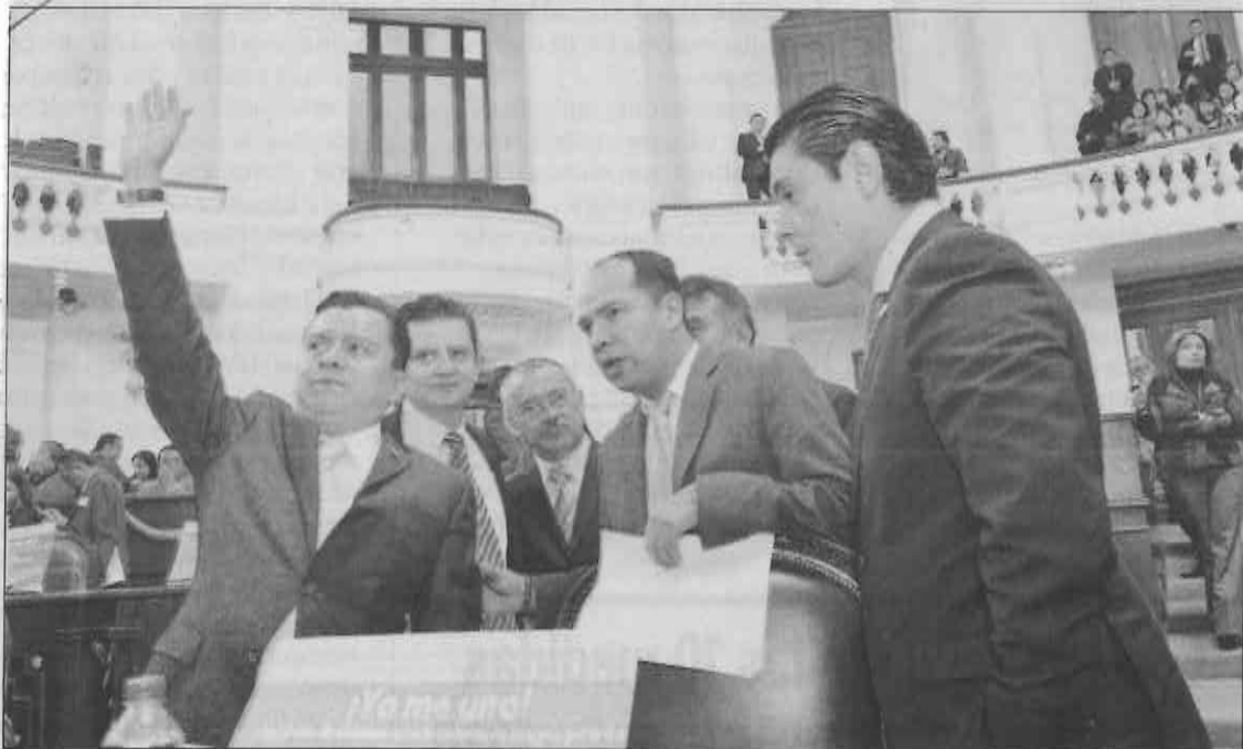
NÚMEROS. Los legisladores determinaron que los recursos garantizan la operación y funcionamiento de ese cuerpo legislativo.

En el proyecto que fue aprobado, los legisladores locales determinaron que los recursos garantizan la operación y funcionamiento de ese cuerpo legislativo en un ámbito de racionalidad y de lo que se alude como dis-