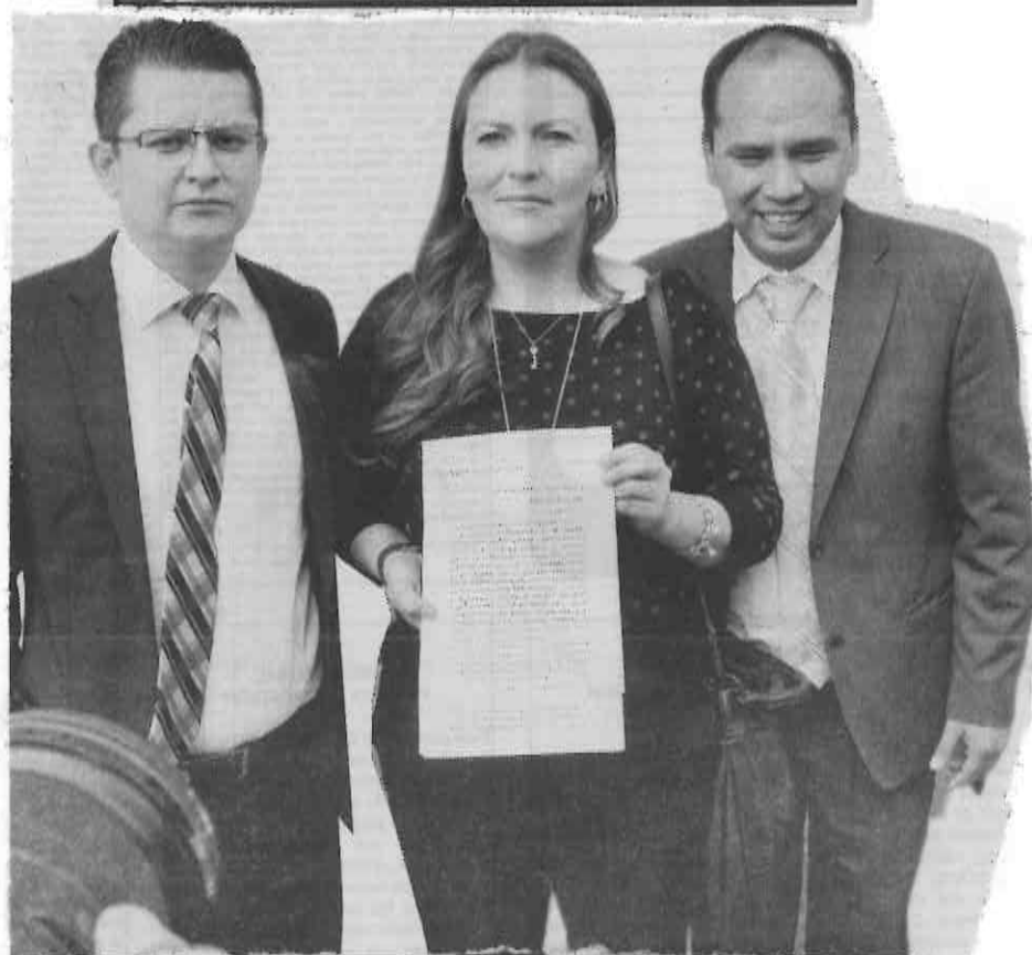
Acta contra legisladores del PAN