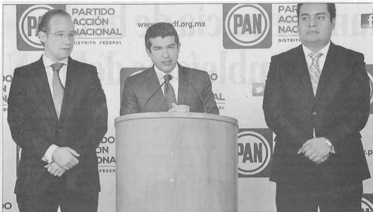
» MAURICIO TABE ofreció conferencia de prensa en la sede panista local.

supuesto de Egresos merece una justificación de política pública clara y abierta, "los ciudadanos requieren respuestas claras de las decisiones que se están tomando en la Asamblea Legislativa", puntualizó.