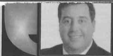
TONATIUH GONZÁLEZ CASE*