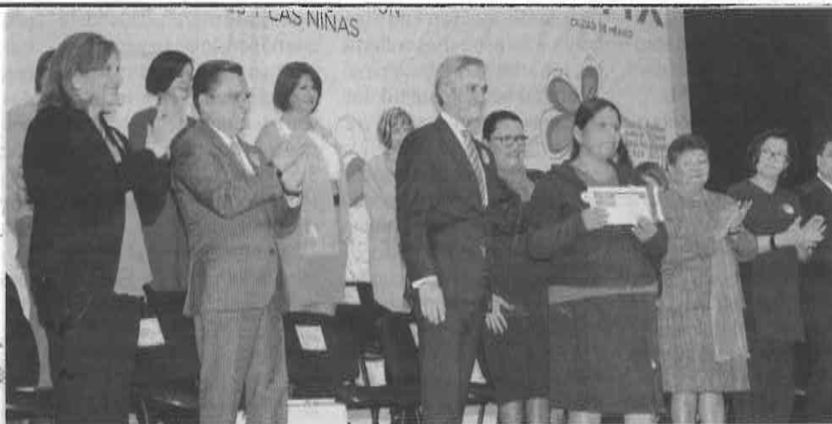
APOYO. El jefe de Gobierno resaltó que cuidar a las mujeres es obligación en el DF