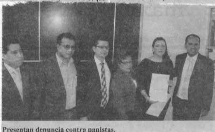
Presentan denuncia contra panistas.

Mientras que el diputado Diego Martínez recalcó "no vamos a permitir que se manche la imagen de la Asamblea Legislativa por la conducta de uno o dos legisladores, por eso hacemos un llamado para que cualquier ciudadano o empresario que tenga algún elemento contra estos diputados, lo presenten de manera formal para que se les castigue como marca la ley".