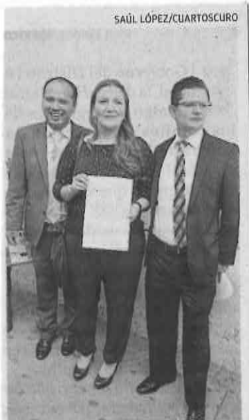
Mostraron el acta.