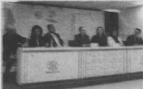
Analizan dictámenes sobre salario mínimo en la ALDF.

Aseguraron que con la aprobación de las iniciativas que el jefe de gobierno del DF, Miguel Ángel Mancera envió a la ALDF, la ciudad de México se colocará a la vanguardia en la recuperación del salario mínimo y a favor de los que menos tienen.