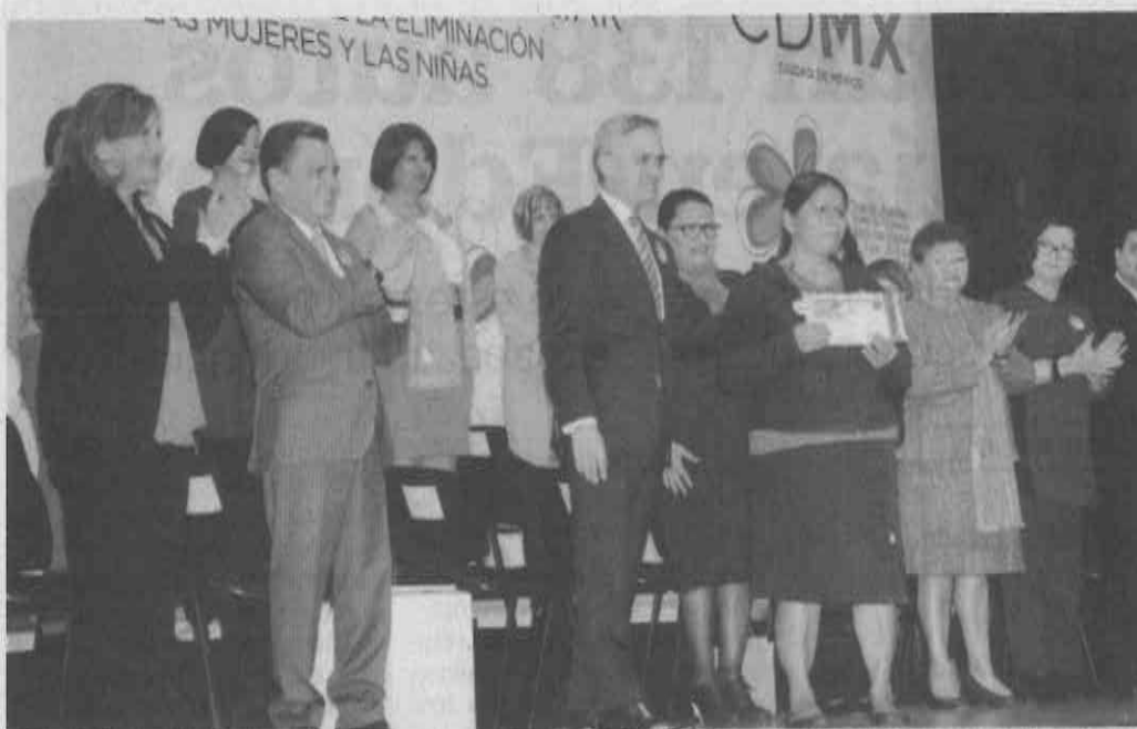
De 2008 a la fecha siete mil mujeres se han visto beneficiadas con el apoyo del programa Seguro contra la Violencia Familiar que consiste en la entrega de mil 537 pesos.