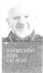
RAYMUNDO RIVA PALACIO