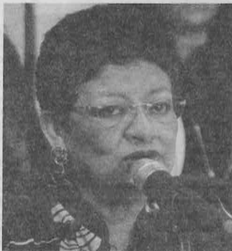
Se requiere crear un fondo para las delegaciones.

Indicó que de acuerdo a un análisis financiero se observa una pronunciada tendencia a la disminución proporcional de los recursos que se destinan a las de-