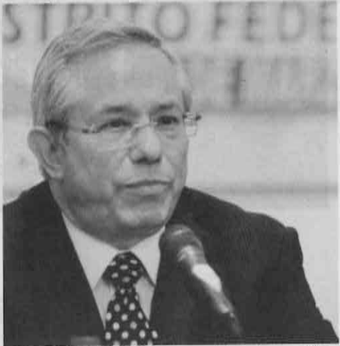
INCREMENTO: La nueva unidad de medida incrementaría a la par de la inflación.

Se espera que hoy se dictaminen las propuestas en comisiones para que puedan someterse a votación en el pleno de la ALDF el próximo martes.