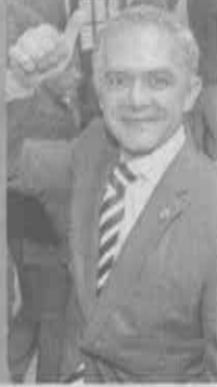
YADIN XOLALPA EL GRÁFICO.

El jefe de gobierno Miguel Ángel Mancera retomó sus actividades después de ser sometido a una cirugía a corazón abierto.