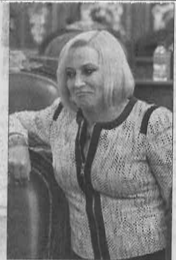
Suspensión PREMATURA de sesión en la Asamblea Legislativa

"Esto es un mal nacional no hay compromiso por parte de nadie a pesar de ver la situación que prevalece en la ciudad, no ha existido ninguna disposición de parte del Legislativo y Ejecutivo de poner orden en la ciudad", agregó. (Notimex)