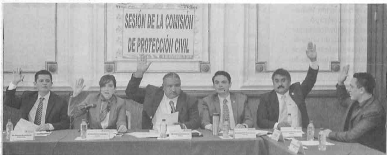
» SESIONÓ LA Comisión de Protección Civil de la Asamblea Legislativa del Distrito Federal.

Finalmente, manifestaron que durante los sismos de este año, los locatarios denunciaron la presencia de grietas o problemas con bardas sin que a la fecha las autoridades delegacionales hayan acudido a estos centros para su revisión.