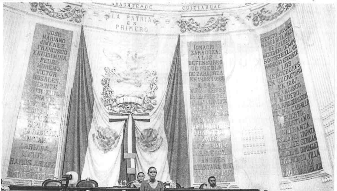
EVALUACIÓN: Las dos propuestas, para crear la Unidad de Cuenta de la Ciudad de México y para dejar de utilizar el término salario mínimo, son analizadas por la Asamblea Legislativa.

● Si el término salario mínimo fuera reemplazado por otra unidad de cuenta, en teoría, ambos podrían aumentar de manera independiente, sin afectar a la economía negativamente ni causar inflación.