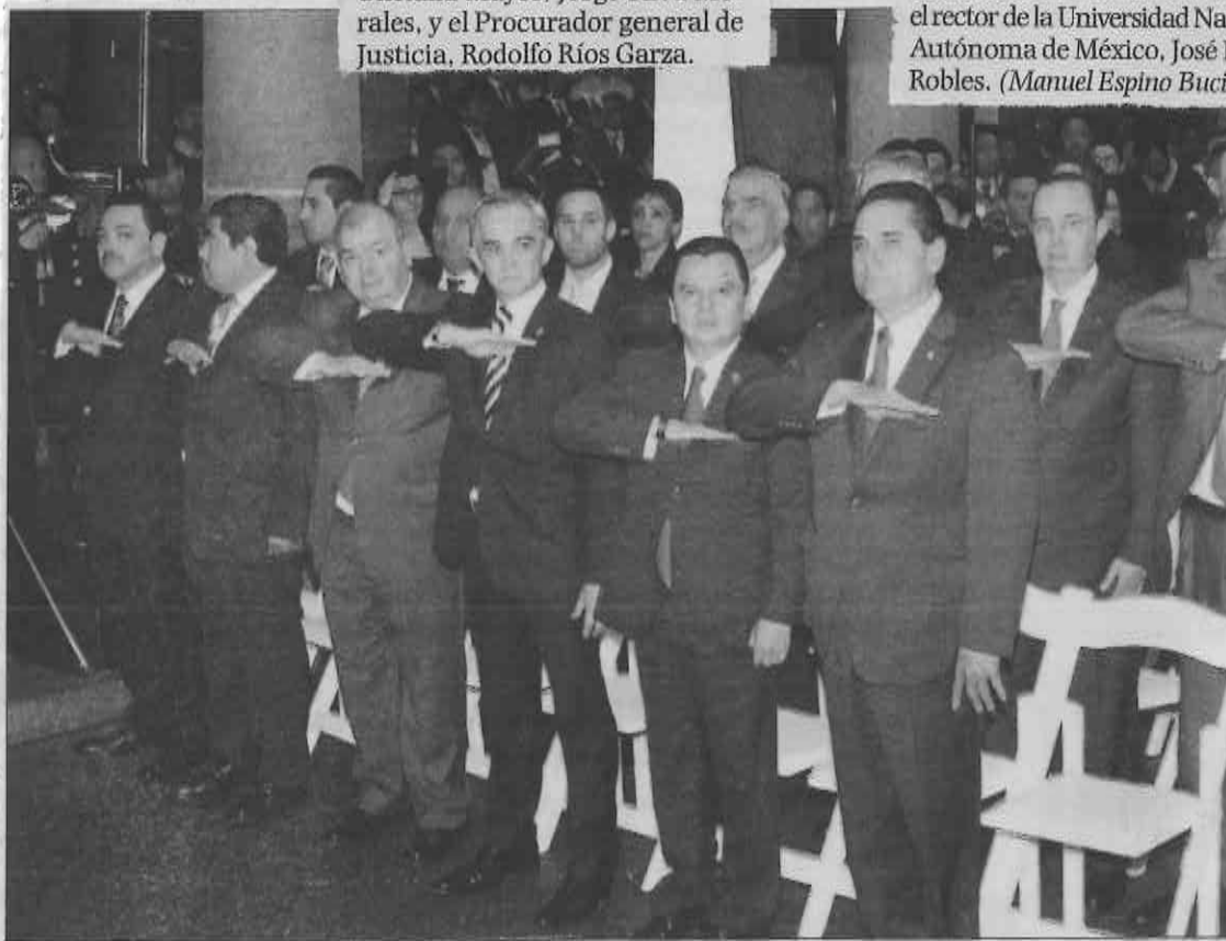
INVITADOS. El jefe de gobierno estuvo acompañado de representantes del Poder Legislativo y Judicial.

A la ceremonia no asistieron el coordinador de Asuntos Internacionales, Cuauhtémoc Cárdenas, y el rector de la Universidad Nacional Autónoma de México, José Narro Robles.