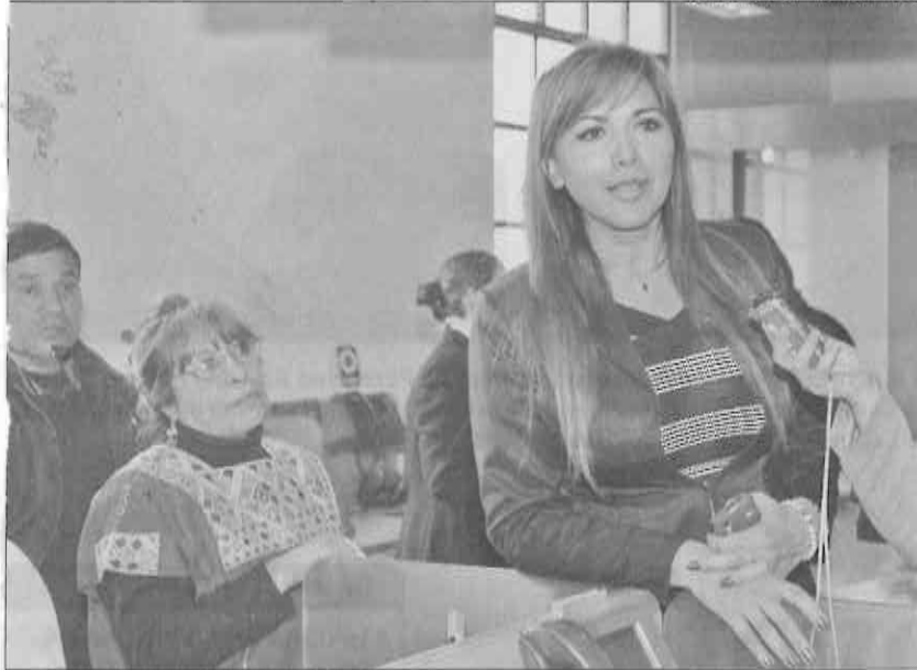
» MIRIAM SALDAÑA Cháirez, diputada local del Partido del Trabajo.