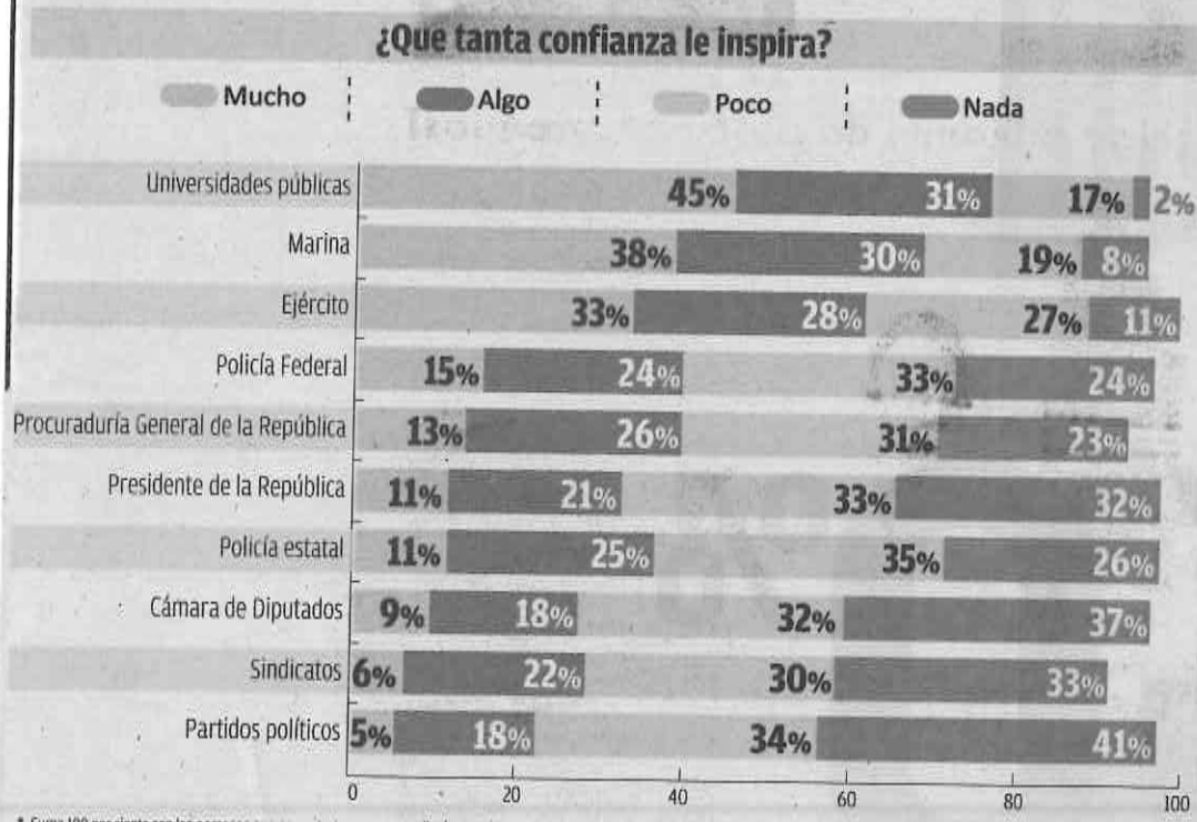
* Suma 100 por ciento con las personas que no contestaron o respondieron no saber. Fuente: Cámara de Diputados | Información: Fernando Damián | Gráfico: Juan Carlos Fleicer

► De acuerdo con la encuesta de la Cámara de Diputados, 76 de cada 100 mexicanos confían de manera positiva en las universidades públicas, mientras que sólo 23 ciudadanos opinan lo mismo de los partidos políticos.