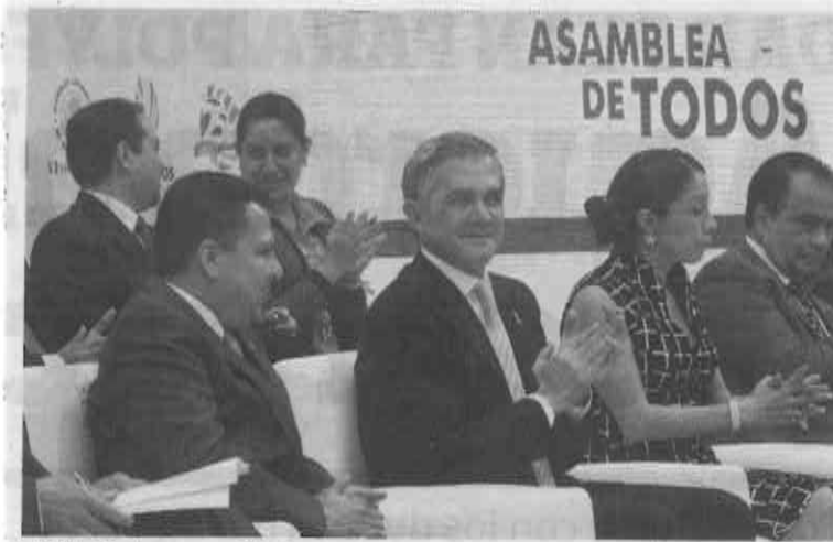
PLANTEA. La personalidad propuesta por Mancera será requisito en concursos.