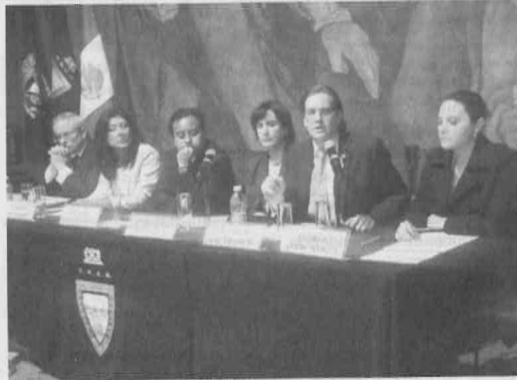
REUNIÓN. Asambleístas y funcionarios resaltaron los beneficios de la Iniciativa.

"Ellos realmente son los que mueven la economía de este país, por lo que no entendemos por qué no habría beneficios con el aumento al salario", señaló Chertorivski.