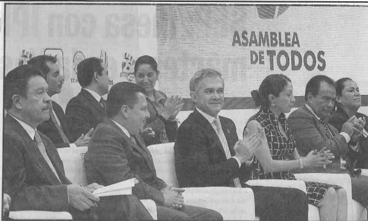
El jefe de Gobierno, Miguel Angel Mancera, inauguró el foro La recuperación del salario mínimo: el papel del Poder Legislativo , convocado por la Asamblea Legislativa del Distrito Federal.