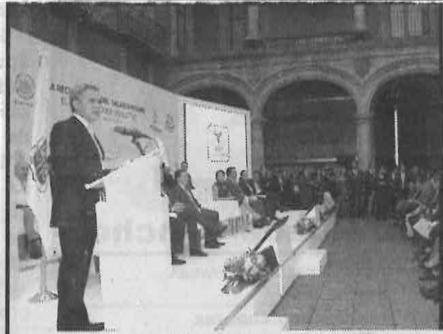
Jefe de Gobierno del DF

Este parámetro se utilizó en países como Uruguay, Brasil, Colombia y Chile, quienes ya han mejorado el salario mínimo que perciben sus trabajadores, así como desvincularlo como unidad de referencia de aproximadamente 180 artículos, de cuatro códigos y 50 leyes locales.