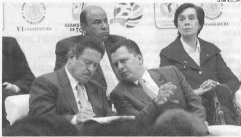
EJEMPLO. El gobierno federal debe ser el primero en 'ajustarse el cinturón', afirman.