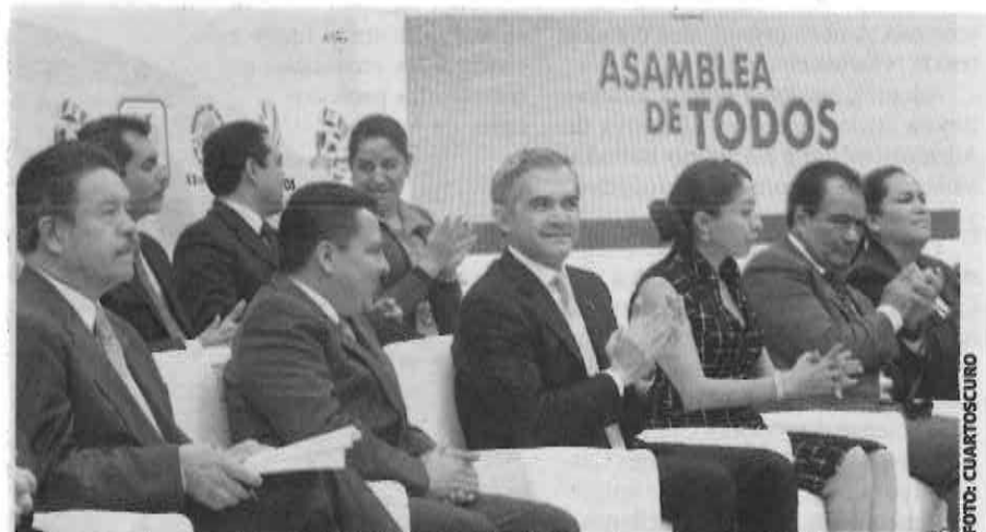
El mandatario anunció que sólo se contratará a "proveedores responsables".

"Creo que hay una gran fuerza aquí en la Asamblea Legislativa, estoy seguro que la Ciudad de México pronto dará este paso", dijo Mancera para luego bromear: "diría que casi tenemos quórum aquí, por si se quisiera dictaminar de una vez, por el número de diputados y diputadas que nos acompañan". ☺