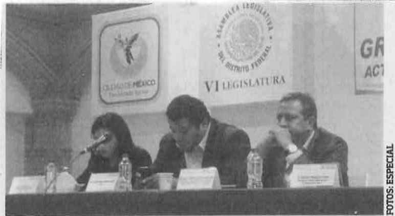
TANTO Y TAN POCO. Afirmaron que no se ha aprovechado el Atlas de Riesgos.

lineales, se estima, es la longitud de las zonas propensas a inundarse.