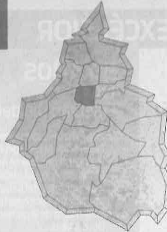
Gráfico: Luis Flores

de construcción dados por las demarcaciones deben existir físicamente.