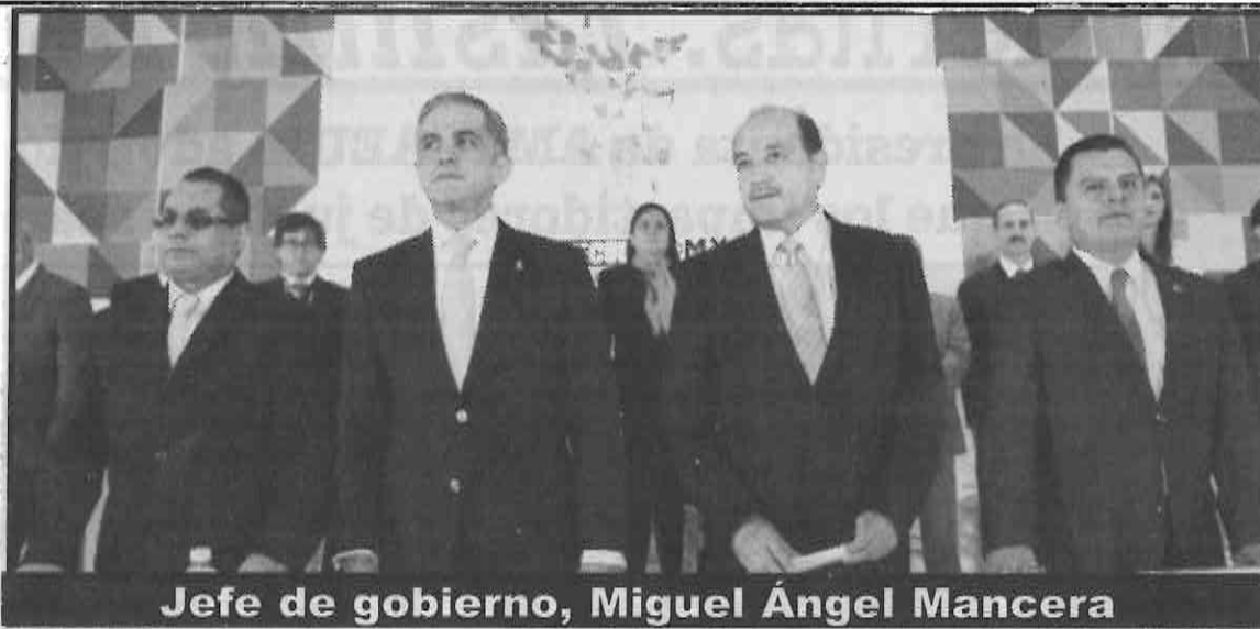
Jefe de gobierno, Miguel Ángel Mancera