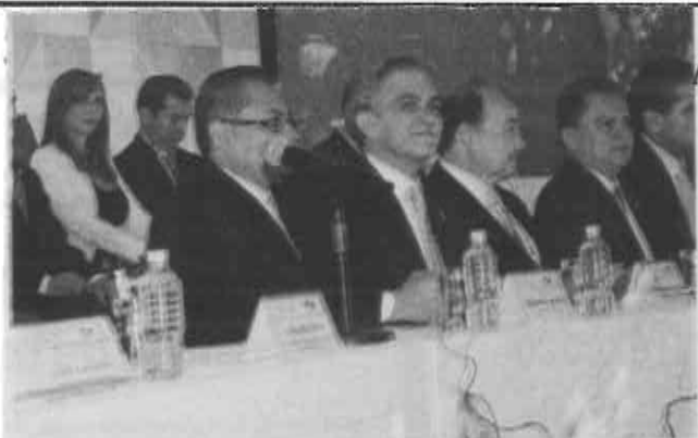
México no puede esperar más para seguir en proceso de crecimiento.