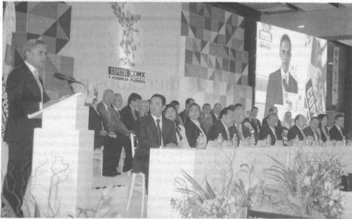
El Jefe de Gobierno capitalino señaló que a la fecha los médicos han visitado más de 400 mil viviendas.