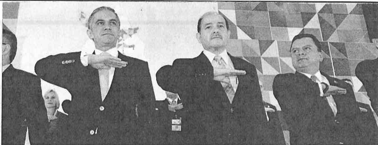
» MIGUEL ÁNGEL Mancera, Felipe Solís, y Manuel Granados, jefe de Gobierno capitalino, subsecretario de Gobernación y líder de la Asamblea Legislativa del Distrito Federal, respectivamente, inauguraron la asamblea de la Copecol.