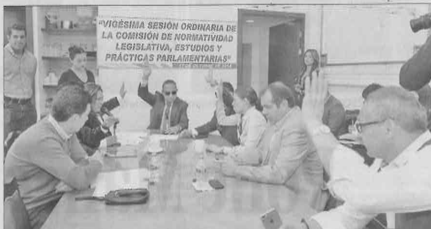
» INTEGRANTES DE la Comisión de Normatividad Legislativa, Estudios y Prácticas Parlamentarias de la ALDF.

Precisaron que la iniciativa sigue dentro la agenda de la VI Legislatura,